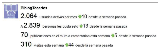
Figura 3. Estadísticas de las redes sociales de BiblogTecarios en Facebook

Página de fans creada próxima a la fecha de inauguración del portal, en octubre de 2010. Desde la página y por medio de la aplicación RSS Graffiti los post del portal se publican automáticamente.