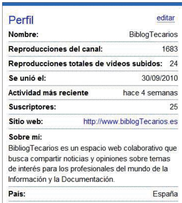
Figura 4. Estadísticas de las redes sociales de BiblogTecarios en YouTube

Canal de vídeos, en el que se enlazan o marcan como favoritos aquellos que se consideran más interesantes y/o divertidos sobre el campo de la biblioteconomía y la documentación. El canal fue creado en octubre de 2010.