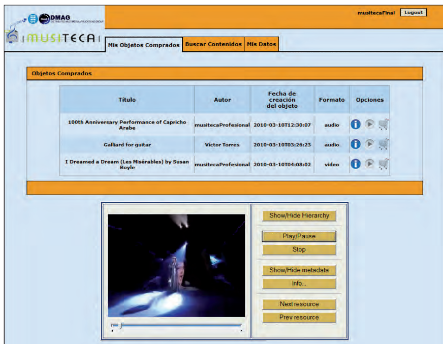
Plataforma desarrollada en el proyecto Musiteca

consiste en un portal web específico que interactúa con una arquitectura de servicios web 33 propia del DMAG 29 .