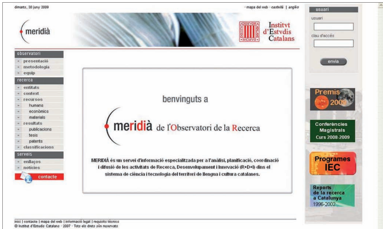
Figura 1. Meridià. http://meridia.iec.cat

– Rectores y vicerrectores de las universidades públicas y privadas.