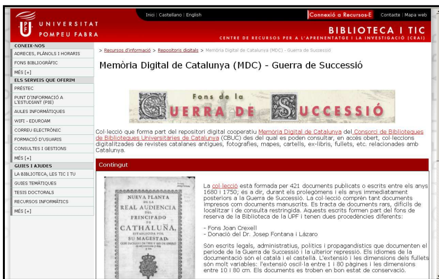
Figura 3. Pàgina de la Biblioteca de la UPF amb informació sobre una de les col·leccions digitals que ha aportat a l'MDC.

Contagion: Historical Views of Diseases and Epidemics is a digital library collection that brings a unique set of resources from Harvard's libraries to Internet users everywhere. Offering valuable insights to students of the history of medicine and to researchers seeking an historical context for current epidemiology, the collection contributes to the understanding of the global, social–history, and public–policy implications of disease. Contagion is also a unique social–history resource for students of many ages and disciplines. 23