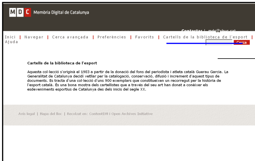
Figura 2. Exemple de notícia inclosa en una pàgina dins de la col·lecció mateixa. S'hi observa que la informació és molt breu, i que no sempre dóna una idea correcta dels materials digitalitzats. En aquest cas, es parla d'uns 900 exemplars de cartells, que corresponen a la col·lecció analògica; de moment, la digital només n'inclou 19.

Les cinc col·leccions de la Biblioteca de la Universitat de Barcelona i les quatre de la Biblioteca de la Universitat Pompeu Fabra enllacen a una pàgina de la institució dedicada a explicar el contingut de la col·lecció digital als usuaris de la pròpia biblioteca. En tots dos casos, la informació s'estructura de manera prou uniforme. La UB inclou els apartats següents: