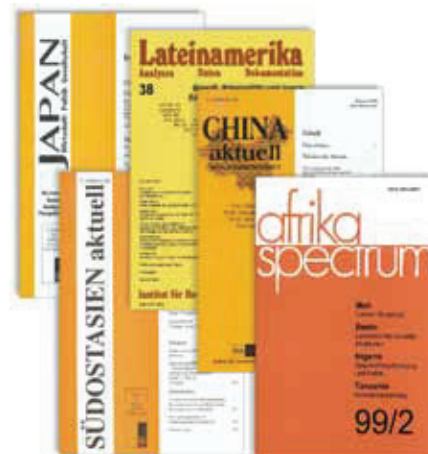
Abbildung 1: Von einzelnen Journals...

Es liegt in der Natur der Sache, dass derartige Vereinheitlichungen nicht immer auf Gegenliebe stoßen. Kompetenzen müssen erteilt und genommen werden und die Redaktionen müssen sich in diesem neuen Rahmen zurechtfinden. Dabei ist auf die verschiedenen Ausrichtungen der Journals und ihrer Leser zu achten.