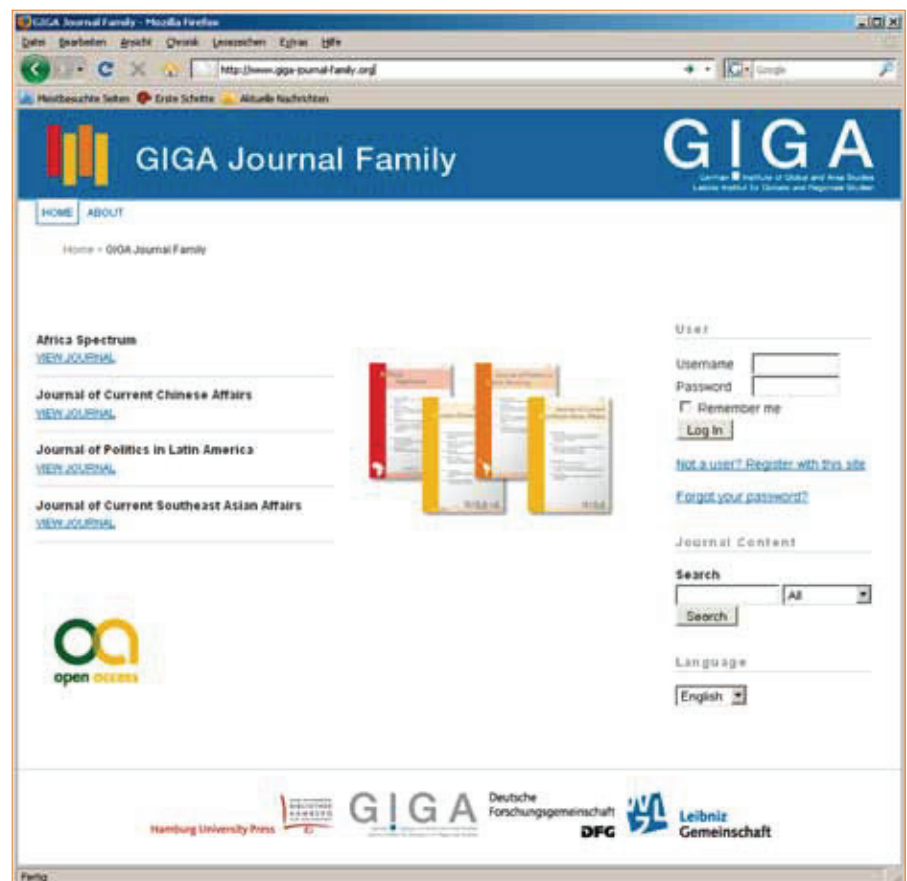
Abbildung 3: ... und zur Open Access-Publikation:

Wesentliche Bedeutung für das Migrationsprojekt der GIGA Journal Family in Open Access hat das gewählte Publikationsmodell. Die Artikel werden nicht