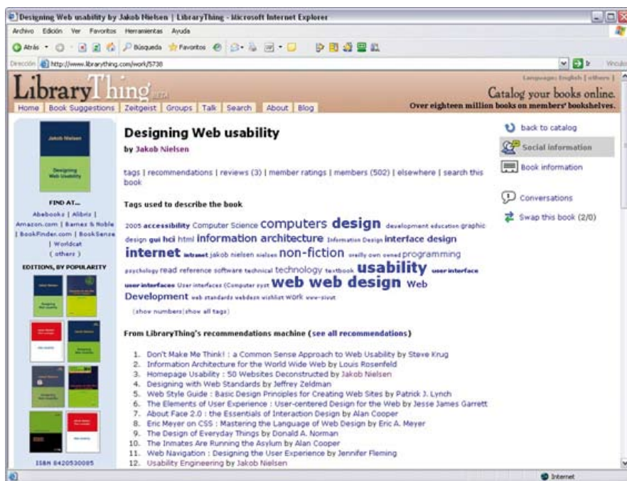
Figura 1. Modelo social de LibraryThing.

sivo al activo, participativo, dejando que el usuario aporte contenido. Llevarlo a cabo no se trata solamente de filosofía, sino de creencia.