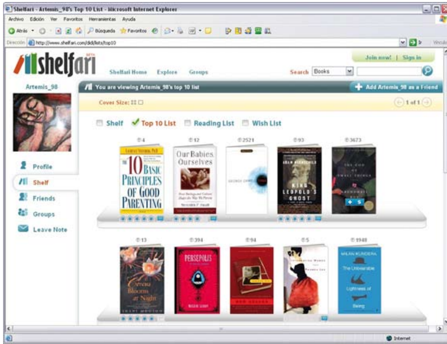
Figura 2. Creación de colecciones personalizadas con Shelfari.

sistema de control de estas entradas, basadas en el concepto de "reputación", al estilo de lo que vemos funcionando con iKarma (o Amazon en su servicio Real Name ). De esta forma, solamente los usuarios que realmente quieran aportar contenido y enriquecer a su vez con sus valoraciones tendrán la posibilidad de hacerlo de forma constante, y otros (que podemos ser nosotros como administradores del sistema) podemos "fiarnos" de las aportaciones o invalidarlas. No hay que olvidar que para muchos usuarios el concepto del "ego" es un componente vital que ayudará a que esto sea realidad, ¿cuántos comentarios a posts de diferentes blogs de referencia no se hacen bajo el ánimo de aparecer referenciado dentro de una fuente de información relevante? Y nuestro catálogo puede llegar a serlo, si no lo es ya.