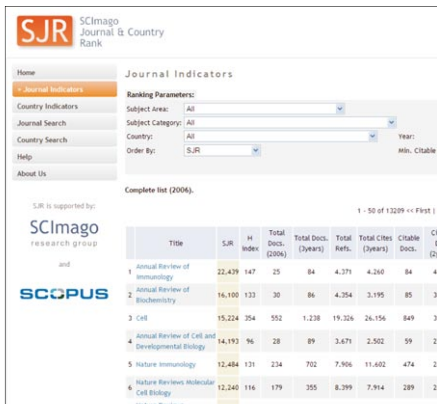
Figura 1. Ranking de revistas

En este informe se encuentran los indicadores ya presentados en