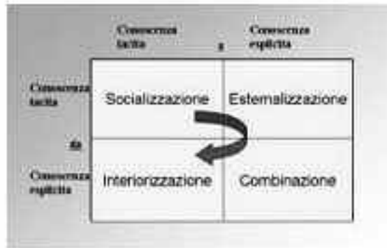
Figura 1 - Schema del processo di creazione della conoscenza (tratto da Wikipedia )

Indicando la dimensione epistemologica, ossia della natura della conoscenza (tacita ed esplicita), su di un asse e sull'altro la dimensione ontologica della creazione di conoscenza (individuale, di gruppo, di organizzazione), si chiarisce ancora meglio la spirale del processo di creazione della conoscenza organizzativa.