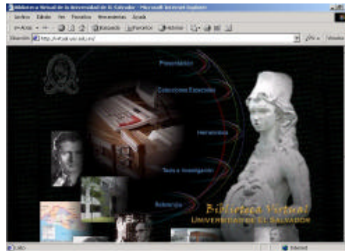
Figura 4 – Portal de la Biblioteca Virtual