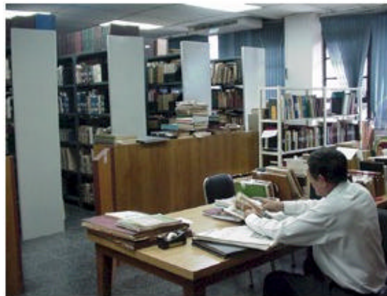
Fig. 2 - Vista Parcial de la Sala de Colecciones Especiales

A mediados del año 2000, la Dirección del SBUES obtiene el respaldo financiero del Consejo Superior Universitario, máxima autoridad académica de la Universidad, para crear una sección de Colecciones Especiales 3 (VER FIG.2).