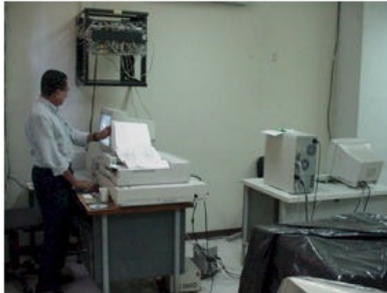
Fig. 3 - Vista Parcial de la Sección de Digitalización

Entre los primeros materiales seleccionados para ser digitalizados, se encuentra la revista "La Universidad", publicada por la UES desde 1888. Esta revista contiene la obra y el pensamiento de rectores, poetas, novelistas, científicos y otros grandes académicos nacionales desde finales del siglo XIX, incluyendo a Rafael Reyes, Salarrúe, Alberto Masferrer, Alvaro Menen Desleal, Matilde Elena López, Roque Dalton, Manlio Argueta, Guillermo Manuel Ungo, Napoleón Rodríguez Ruiz, Romeo Fortín Magaña, entre muchos otros. Gracias al apoyo recibido de parte de la Biblioteca Nacional de El Salvador y de la Biblioteca Dr. Manuel Gallardo, se logra completar en un alto porcentaje la existencia total de la revista, iniciándose así su "captura" y organización electrónica. Simultáneamente, utilizando un escaner de alta velocidad, se inicia un proceso de copiado digital de las tesis universitarias impresas, partiendo del año 1999 5 .