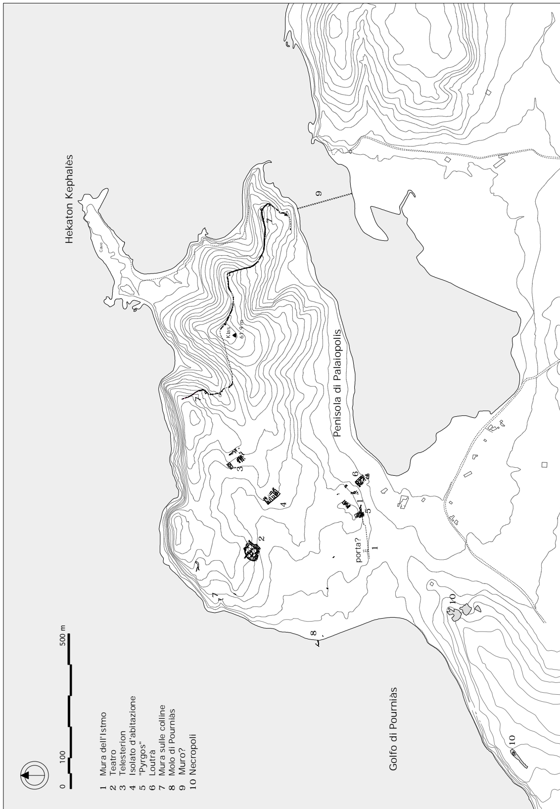
Fig. 1 – Efestia. Pianta della città