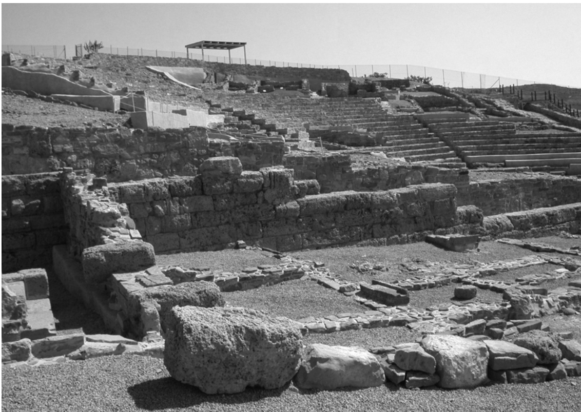
Fig. 2 – Efestia. Il teatro