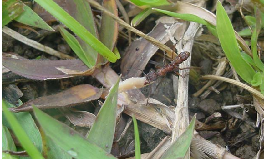
Figura 1. Ectatomma ruidum cargando “atún en aceite” hacia su nido en un potrero abierto (Foto por C.S.).

Análisis de Datos: La distribución espacial de los nidos de E. ruidum dentro del área se determinó mediante el método de Clark & Evans (1954) del índice del vecino cercano. Este índice está basado en la comparación de la distancia observada entre dos nidos vecinos y la distancia teórica que se observaría si los nidos fueran distribuidos al azar. El índice R es el cociente de la distancia promedio observada y la distancia promedio esperada bajo el supuesto de que el proceso es aleatorio. Si el valor del cociente está cerca de 1 la distribución será aleatoria (A), si esta cerca de 0 será agregada (C) y si es superior a 1 será uniforme (U). Por otro lado, se tomaron los datos primarios provenientes