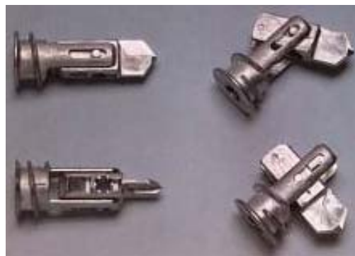
8. ábra: Önmetsző rögzítőcsap