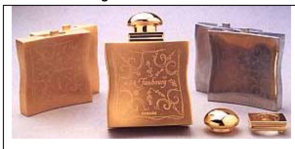
3. ábra: Aranyozott párolgatókészlet