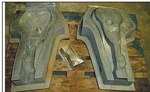
2. ábra: Mélyhúzószerszám Kayem-ötvözetből

A Kayem-ötvözetek önthetősége kiváló: a legfinomabb részletek is tökéletesen kialakulnak a formában, a megszilárdulásakor fellépő deformációk csekélyek, ami jelentősen csökkenti az utómunkálatokat, gyakran el is hagyhatók. Könnyűszerrel lehetséges vegyes anyagú (Kayem/acél) szerszámokat is készíteni, amikor a matrica vagy a bélyeg anyaga acél. A Kayem-ötvözetből készített szerszámok az önkellő jellegük miatt szorosan illeszthetők.