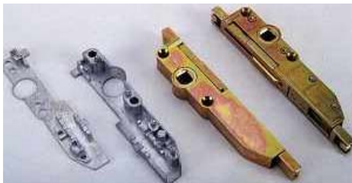
7. ábra: Ablaknyitó-szerkezet alkatrészei

A fából, ill. műanyagból készült ablakkeretek nyitó-záró szerkezete is gyakran készül horganyötvözetből (8. ábra). Számos apró alkatrészt tartalmaznak, amelyek szilárdsága és kopásállósága is kedvező. A teljesen acélból készülő szerkezetekhez képest 30%-os méretcsökkenést lehet elérni a Zamak-ötvözetekkel, amely igen előnyös az ablakkeretekbe munkálandó fészkek készítésekor.