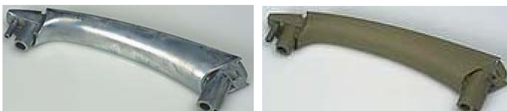
11. ábra: Luxusautó ajtókilincse öntött és „bőrhatású” állapotban

A felsőkategóriás gépkocsik egyik lényeges különbsége a tömegautókhoz viszonyítva, hogy nem takarékoskodnak az anyagválasztásnál. Nemcsak a kárpit bőr, de itt nem mellőzik a rozsdamentes acélt, az alakemlékező ötvözeteket stb. A 12. ábrán látható kilincs ZL-3 ötvözetből készül precíziós öntéssel. A hornyok belemarása után kromatózással, majd „lágý” festékkel nyeri el végső, „bőrhatású” felületi minőségét.