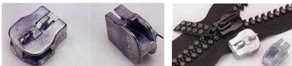
12. ábra: Húzózá

Kevés olyan termék van, amelyet ennyien használnak – és ennyire nem tudják róla, hogy miből is készül. A 12. ábrán bemutatott húzózá 4 alkatrészt tartalmaz. Az acél sapkával és rugóval ellátott csúszkatest, valamint a kengyel horganyötvözetből készül. Az automatikus összeszerelés miatt a mérettűrései 0,05 mm-esek. Az öntvénynek a könnyű mozgathatóság miatt nagyon finom felületűnek kell lennie a belső lapokon is.