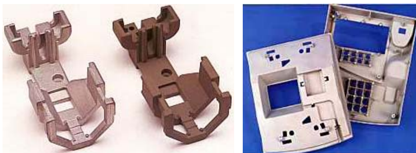
9. ábra: Saru optikai kábelek toldására

A 10. ábra olyan telefonkészülék-ház sorozatgyártás előtt utolsó prototípusának két felét mutatja, amelyet Franciaországban kizárólag exportra gyártanak. A legvékonyabb falak vastagsága alig éri el az 1 mm-t. Az utcai telefonkészülékek prototípusa ZA-12 (Ilzro12) ötvözetből készült precíziós homokformaöntéssel. A sorozatgyártás precíziós öntéssel zajlik.