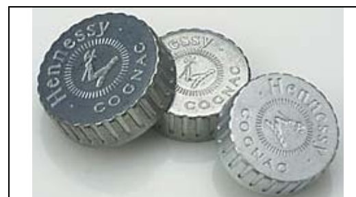
4. ábra: Italospalackok zárókupakja

A márkás italok üvegeinek esztétikus, luxus-hatást keltő zárókupakjait (4. ábra) gyakran készítik nyomásos öntéssel Zn-ötvözetből, majd ragasztással összeszerelik a parafabéléssel. A feliratok, vésetek természetesen már az öntőformában kialakulnak. A felületet polírozással finomítják. Az arany, ezüst, króm, nikkel díszítés galvanizálással, PVD-eljárással, ill. festéssel, lakkozással készül.