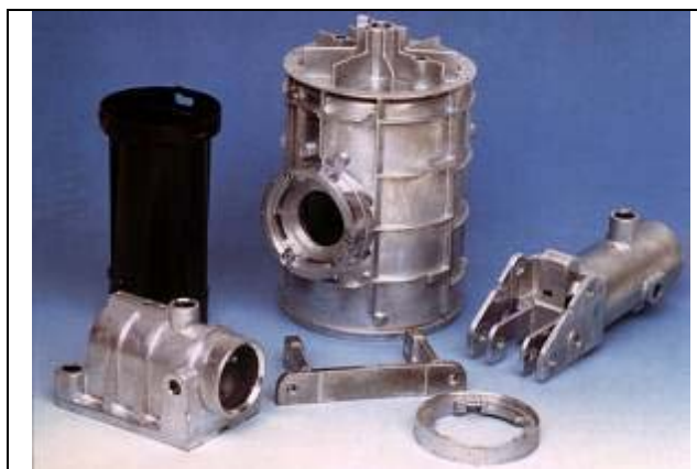
5. ábra: Röntgensőfoglalata és rögzítőelemei