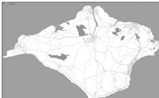
A brit Wight-sziget (Isle of Wight) teljes, utcaszintű digitális térképe ( OpenStreetMap.org )

Mint az látható, a világhálós közösségi szolgáltatások többségére jellemző a nyitottság, a könnyű hozzáférés. A már említett nagy nemzetközi lefedettséggel rendelkező térképes szolgáltatásokat Magyarországon is sokan használják. A valós közösségi kommunikációt megeremlítő technológia és környezet a magyar térképszolgáltatók számára is nyitva áll, ám ezzel egyelőre kevesen élnek. A hazánkban érvényben lévő szigorú adatpolitika miatt a földrajzi adatok publikálása komoly jogi nehézségekbe ütközik. Hasonló problémával az Egyesült Királyságban is szembesültek a felhasználók, így az állami térképkészítő céget (az Ordnance Survey-t) megkerülve saját GPS-es adatgyűjtésbe kezdtek. A felmért és feldolgozott adatokat az OpenStreetMap.org egy nyílt felületen keresztül publikálja „Creative Commons”