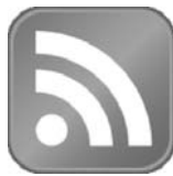
Az RSS folyam hagyományos ikonja

Az RSS hírszál igazi ismertségét a hamarosan megjelenő Internet Explorer 7 és Mozilla Firefox 2.0 webböngésző fogja megteremteni, ahol kiemelt funkció lesz az „élő könyvjelzők” felvétele, illetve olvasása. A népszerűséget tovább növelheti, hogy a legnépszerűbb közösségépítő webes terek is kezdik felfedezni és alkalmazni a lehetőséget.