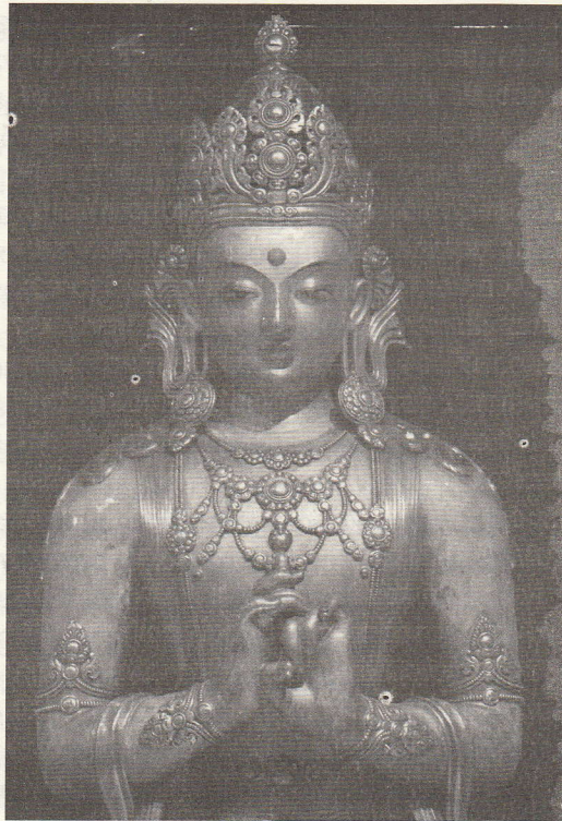
Занабазарын нэрэмжит Дүрслэх урлагийн музей, Нанзад бурхан