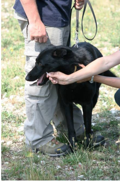
1. ábra. Örökítőanyag mintavétele fültisztító pálcikával