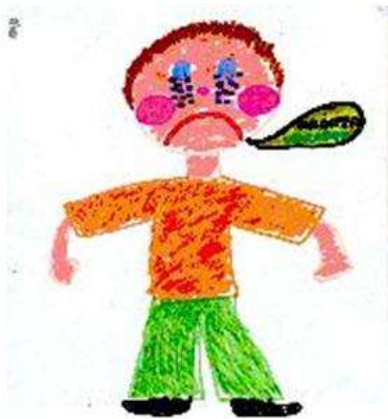
1. rajz: Vesztés. Csak a vesztes jelenik meg a rajzon „Fránya verseny!” (8 éves lány)

A versengéssel és a győzelemmel kapcsolatban a gyerekek többsége (72% és 80%) mind a potenciális (versengés) mind a tényleges győztest és vesztest megjelenítette a rajzán (győzelem). A vesztéssel kapcsolatban a lányokra jellemzőbb, hogy nem ábrázolják a győztest és a vesztest együtt, hanem csak a vesztest (23%) rajzolják le, vagyis „izolálják” a vesztest a szociális környezetétől. Ezekben a rajzokon a vesztes gyakran egyedül van és sír. (1. rajz) A lányok vesztés rajzainak majdnem egyharmada (32%) nem tartja egyben a győztes és vesztes felet, szemben a fiúk rajzainak csak 13% -ával (Fisher-egzakt próba p = .78 , tendenciaszinten szignifikáns).