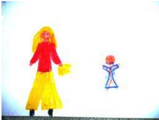
4. rajz. Vesztes. 8 éves lány.

különbséget (Khi-négyzet = 1,316, p = ,251 , n.s.) viszont mind a győzelem mind vesztés esetén szignifikánsan nagyobb valószínűséggel rajzolták a gyerekek a győztest nagyobbnak, mint a vesztest (Győzelem: Khi-négyzet = 20,455, p < ,0001 ; Vesztes: Khi-négyzet = 18,778, p < ,0001 ).