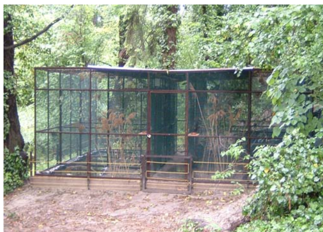
1. ábra. A Gödi Biológiai Állomásán felépített és berendezett beltéri aviárium (baloldali kép), és kültéri aviárium (jobboldali kép).