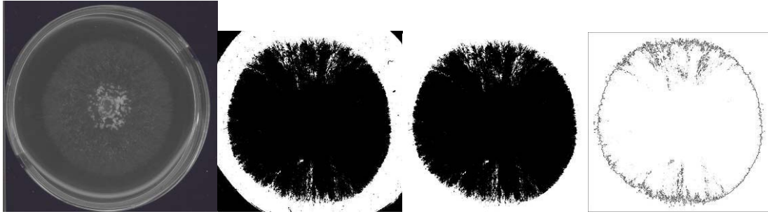
1. ábra Beszkennelt telepkép.