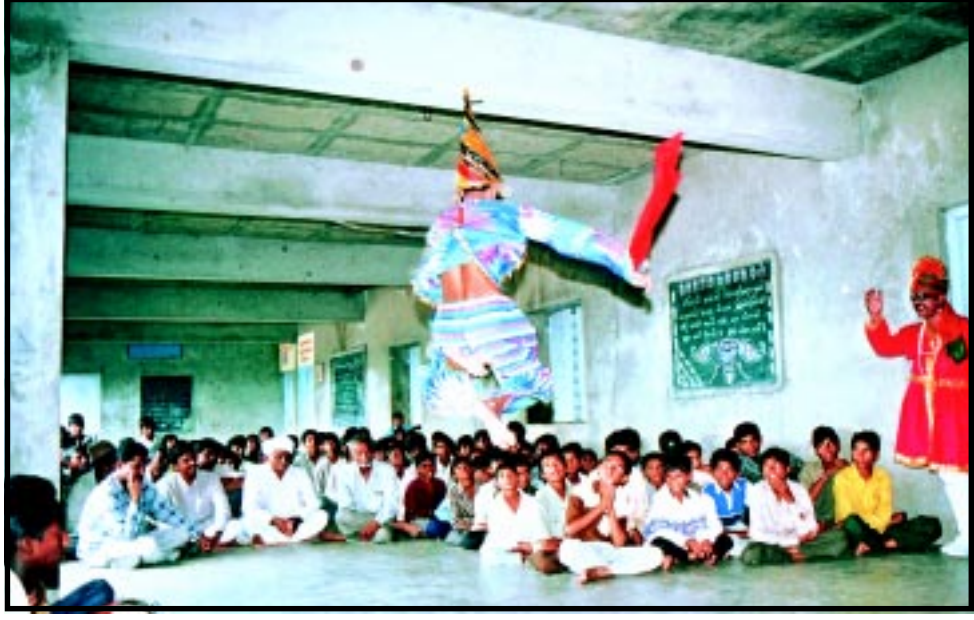
વ્યસનોની ગંભીરતાને મનોરંજક ઢબે ગ્રામ્ય બોલીમાં તાલ-લયબદ્ધ રૂપે રજૂ કરતો રંગલો