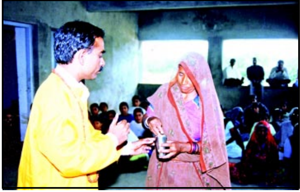
ભોળા ગ્રામજનોને છેતરતાં લેભાગુઓ ધર્મ આડંબર કરી, ખાલી ગ્લાસમાંથી પ્રસાદ, તાવીજ/ડોડી, મૂર્તિ વગેરે કંઈ રીતે હાથ ચાલાકીથી કાઢી બતાવે છે તેની પ્રત્યક્ષ સમજ મેળવતાં ગ્રામ્ય મહિલા