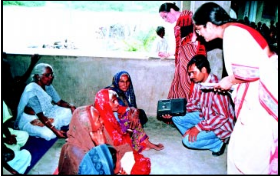
વહેમ-અંધશ્રદ્ધા બાબતે ગ્રામ્ય મહિલાઓના મનની વાત જાણવા પ્રશ્નોત્તરી કરતાં પ્રયોજક