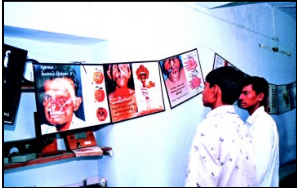
વ્યસનથી થતી ભયંકર શારીરિક દુર્દશાનું ડિહામણું ચિત્ર જોઈ અવાજ થઈ ગંભીર બનેલા ગામનાં યુવાનો