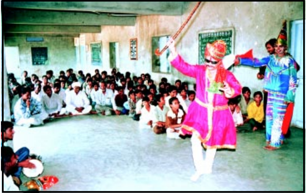
વ્યસન મુક્તિનો ભવાઈવેશ દ્વારા રજૂ થતો સંદેશ ઝીલતા ગ્રામજનો