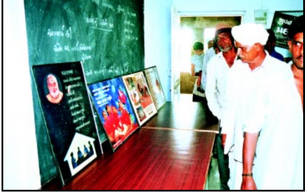
વ્યસન મુક્તિ અંતર્ગત પ્રયોજકે પ્રદર્શિત કરેલ પ્રદર્શનને નિહાળતા ગ્રામજનો