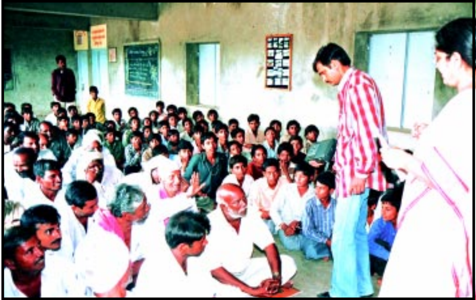
વ્યસન મુક્તિ માટેની પ્રવૃત્તિઓ યોજાયા બાદ ગ્રામજનોને મુક્ત પ્રશ્નોત્તરી કરી અભિપ્રાયો મેળવતાં પ્રયોજક