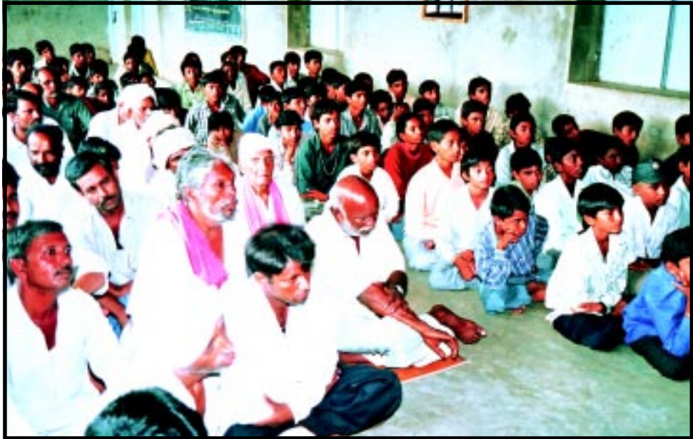
વહેમ-અંધશ્રદ્ધા નિર્મૂલન અંતર્ગત થઈ રહેલા વિવિધ પ્રયોગો આશ્ચર્યભાવે નિહાળતાં ગ્રામજનો