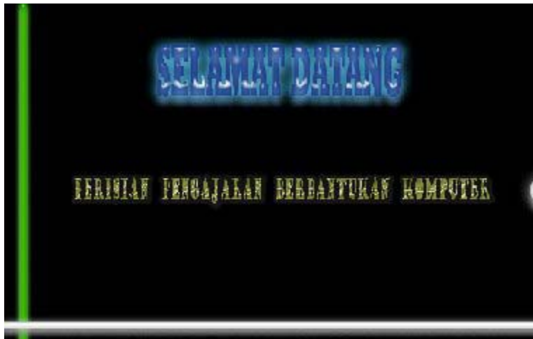
Rajah 1 : Paparan Montaj Selamat Datang