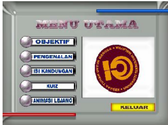
Rajah 3 : Paparan Menu Utama