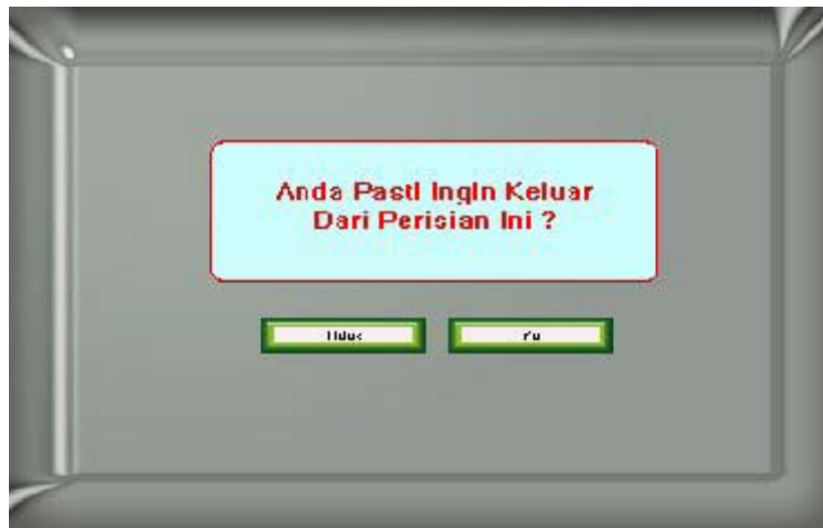
Rajah 4 : Paparan Keluar Perisian

Bahagian ini akan memberi pilihan kepada pengguna untuk meneruskan melayari perisian ataupun untuk menamatkan penerokaan terhadap perisian seperti dalam rajah 4. Untuk keluar pengguna perlu menekan butang keluar yang disediakan pada menu utama. Pengguna akan ditanya pasti ataupun tidak untuk keluar, jika 'tidak' pengguna akan dibawa kembali ke menu utama. Jika 'ya' pengguna akan keluar dari perisian dan dipaparkan paparan seterusnya iaitu penghargaan sebelum benar-benar tamat.