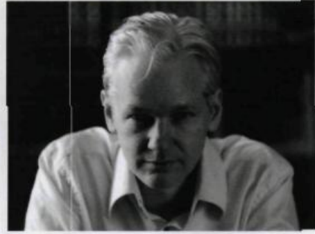
Julian Assange, Wikileaks belgelerini 256 bit AES algoritmasıyla şifrelemiştir.

Akla gelen ilk çözüm, tüm anahtarları deneme yoluyla kriptanaliz yapmak olsa da anahtar boylarının uzunluğu nedeniyle pratikte bu pek mümkün değil. AES örneğiyle devam edelim, AES'in üç standart anahtar uzunluğu var: 128 bit, 192 bit ve 256 bit. En kısa anahtar boyu olan 128 bit kullanılsa bile olası anahtar sayısı 38 basamaklı. Bu kadar çok anahtarı günümüz bilgisayar teknolojisini kullanarak makul bir sürede deneme-yanılma yoluyla test etmek imkânsız. Çünkü saniyede bir trilyon deneme bile yapsak bu tür bir analiz ortalama 54 katrilyon yüzyıl alır. Bu nedenle kriptanalistler daha karmaşık istatistiksel yöntemlerle şifreli metin, düz metin ve anahtar arasındaki