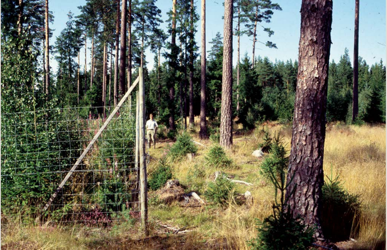
Figur 1. Efter några år kan vegetationen se väldigt olika ut innanför och utanför ett referenshägn.

Jonas Bergquist ▪ Jean-Michel Roberge ▪ Lars Edenius ▪ Göran Ericsson