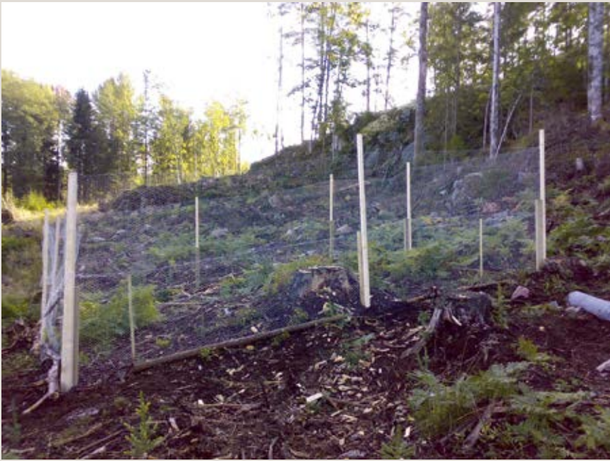
Figur 2. Nyuppsatt referenshågn i Misterhultsområdet (norr om Oskarshamn, Kalmar län) inom temaprogrammet Vilt och Skog. För att underlätta vid uppsättning är stolparna sammansatta av en kort och grov förankringstolpe och en påmonterad bärstolpe.

■ Hjortdjuren (älg, rådjur, kron- och dovhjort) påverkar vegetationen och dess utveckling genom bete och andra aktiviteter. I en plant- eller ungskog finns vanligen ett antal olika trädslag representerade och dessa konkurrerar med varandra om att dominera ytan. Efter-som vissa lövträd och tall betas hårdare än t.ex. gran så försvagas deras konkurrensförmåga. Denna påverkan kan vara så stark att endast de mest vilttåliga träden klarar sig kvar och bildar den framtida skogen. Detta innebär ofta att målsättningar om önskvärd trädslags-sammansättning i våra skogar inte kan uppnås.