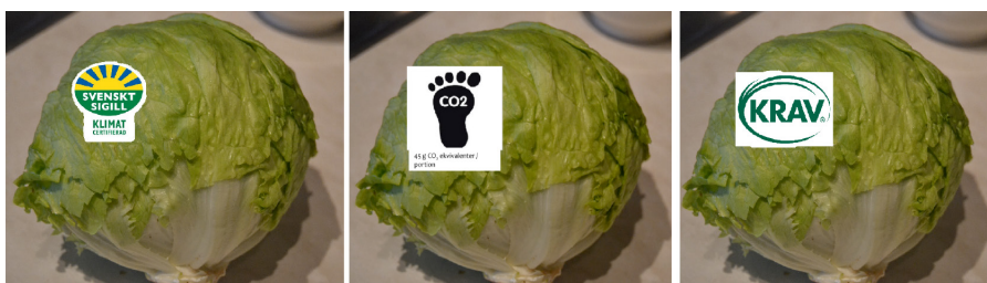
Bild 1. Tre klimatmärkningar