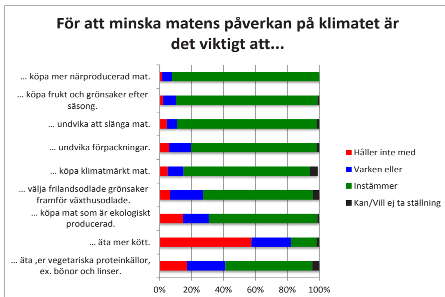
Diagram 2. Konsumenternas förslag på hur man minskar matens klimat effekt. n=181-183

För att få en djupare förståelse för vilka faktorer som spelar in när konsumenten