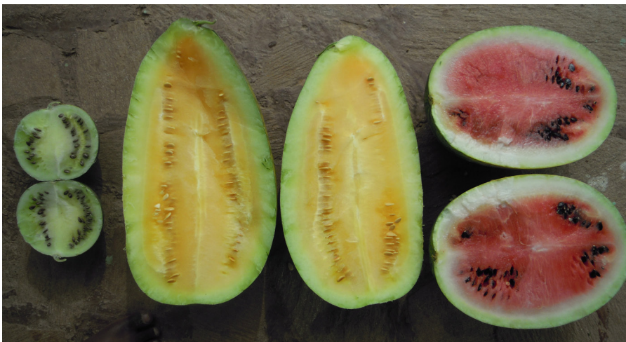
Fig. 4. Vattenmeloner, från vänster ogrästyp, cow-melon och söt vattenmelon