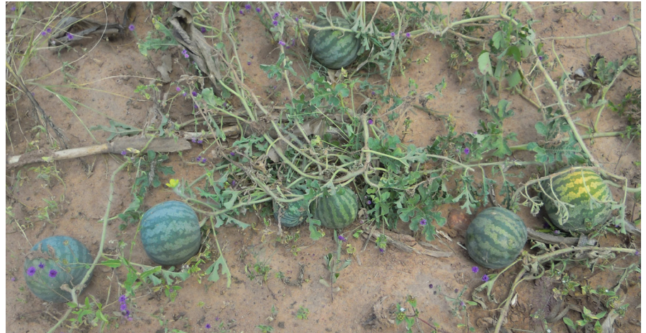
Fig. 3. Vildväxande ogrästyp av varietet citroides