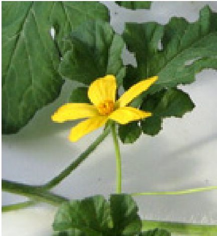
Fig. 2. Hanblomma på vattenmelon i Balsgårds växthus