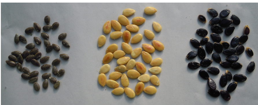
Fig. 5. Frön av vattenmelon, från vänster ogrästyp, cow-melon och söt vattenmelon

Men det finns alternativa hypoteser; femtusenåriga frön av vattenmelon har hittats i Libyen, och historiska bevis antyder att vattenmelon odlats i Egypten och angränsande områden i nära 4000 år. Analyser av kloroplast-DNA vi-