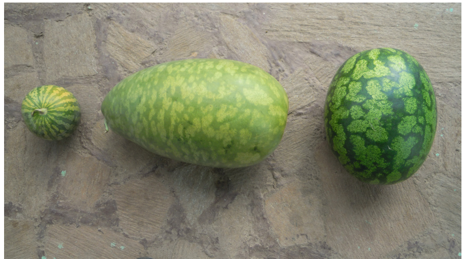
Fig. 1. Lantraser av vattenmelonar, från vänster ogrästtyp och cow-melon (varietet citroides ) och söt vattenmelon (varietet lanatus )

Den odlade vattenmelon tillhör familjen gurkväxter (Cucurbitaceae) och släktet Citru-