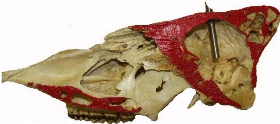
Figur 2. Nötskalle i genomskäring med penetrerande bult.