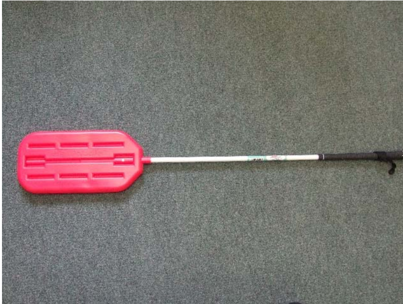
Figur 3. Drivningspaddel.