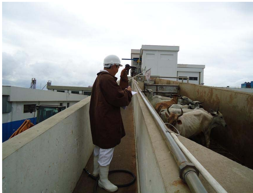
Figur 4. Djurskyddsansvarig genomför daglig översyn enligt check-lista.

I Brasilien är det särskilda ansvaret för djurväl-färden förenat med hög status hos de djurskyddsansvariga. Denne är på samma nivå som produktionschef och kvalitetschef och direkt underställd VD och styrelseordförande. Daglig översyn av djurväl-färden görs enligt en check-lista (figur 4).