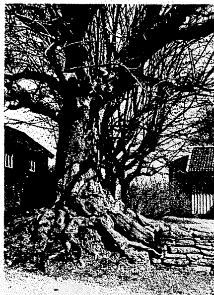
Fig. 1: Ask som står som vårdträd på en gård i Hästeryd i Västergötland. Ur Svenska vårdträd, Ewald 1983.

Det var viktigt att sköta och skydda vårdträdet så att dess innevånare trivdes. Man fick varken bryta grenar av trädet eller ta ett enda löv. Till omsorgen om vårdträdet hörde också att man offrade mat och dryck till det. Detta skulle helst ske på torsdagskvällarna efter att man städat stugan för att fira torshelgen, en sed som fanns kvar långt in på 1800-talet. Även på kvällarna under de stora högtiderna, särskilt på julafton, borde man ge gåvor till vårdträdet. Oftast bestod gåvorna av mjölk eller öl som man hällde över trädets rötter. På julafton skulle man även uppvakta med smakbitar av julmaten (Tillhagen 1995).