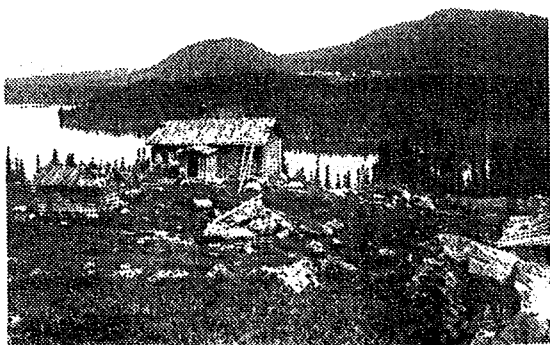
Figur 1. Finskt hemman i svensk skog (Löw, K).

En del av de finnar som bosatte sig i Orsa finnmarker kan också ha kommit via Värmland och det starka fäste finnarna fått där. När finnbygden där började expandera stötte man på hinder i form av tätbefolkade trakter kring Dalälven som beboddes av svenska bönder. Dessutom var trycket från det framväxande bergsbruket som störst i dessa delar av landet. Däremot fanns gott om utrymme i de fria skogsmarkerna längre norrut i ovan nämnda gränstrakter, och en del trängda finnar drog sig då i ett steg dit upp (Broberg 1988).