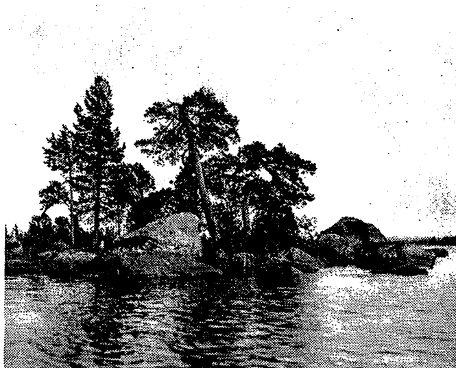
Figur 4. Björnskalleholmen där finnarna hängde upp sina jakttroféer (Gothé 1950)

Det finska folket var mångsysslare och jakt och fiske utgjorde välkomna tillskott till hushållet. Dessutom tjänade man en del pengar på försäljning av hare och fågel. Dessa djur snarades och vissa gårdar kunde ha tusentals snaror ute samtidigt. Till de övriga villebråden hörde älg, som jagades genom hetsjakt, och vildren, som togs i fångstgrop. (Gothe 1950). Björnjakten var mytomspunnen och man använde sig över huvud taget mycket av besvärjelser och trolldom i vardagslivet för att få lyckade fångster eller skördar. I Finlands nationalepos Kalevala finns beskrivet hur troféer från björnjakten skulle hängas “...upp i toppen av en furu, i ett hundrakvistigt tallträd.” Ett sådant träd kan bevittnas på Björnskalleholmen i Fågelsjön belägen i Hamra kronopark, där kilarna som använts vid uppsättandet av björnskallarna fortfarande sägs kunna urskiljas.