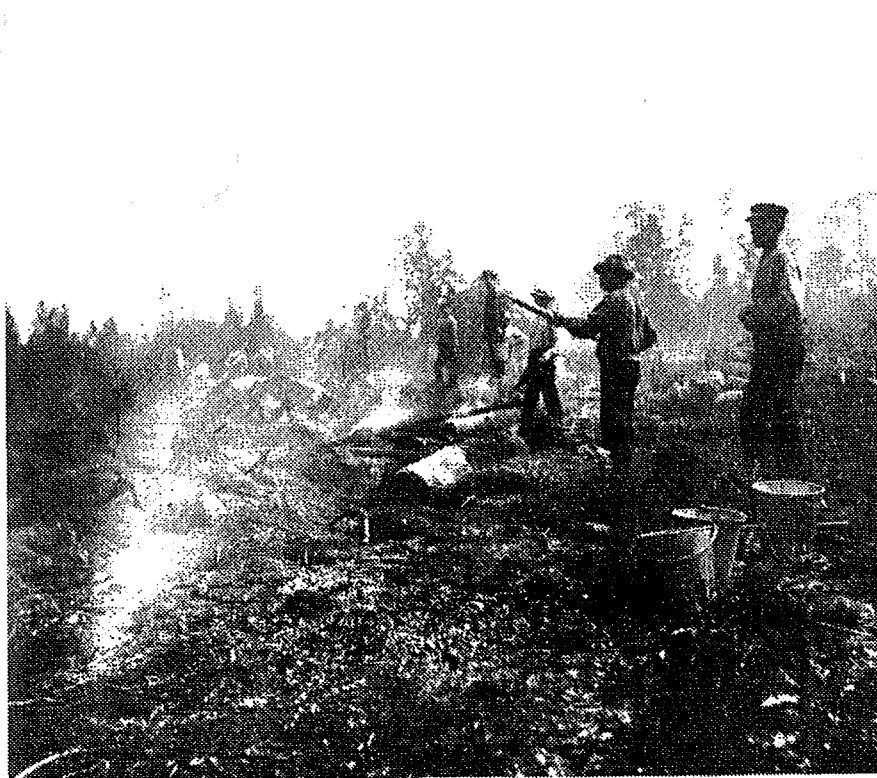
Figur 3. Bränning av svedja i början av 1900-talet (Löw 1985).

Det fanns säkert oändligt många varianter av metoder för svedjande av barrskog, var och en utformad efter rådande klimat och andra yttre förhållanden (Bladh 1995). Bl.a finns metoder som medförde flera såväl bränningar som skördar, och med andra sädesslag (Orrman 1995). Ett exempel på hur en barrsvedja kunde utnyttjas är dock som följer: Träden på den blivande svedjan fälldes, eventuellt efter att ha ringbarkat de grövsta träden några år tidigare, och efter 1-2 år skedde bränningen. Rågen såddes sedan direkt i askan, och skördades följande år. Endast en skörd togs ut, och därefter användes marken för bete (Orrman 1995, Tarkiainen 1990). Omloppstiden för en svedjeyta låg någonstans runt 20-40 år. Vid det laget hade lövskog växt sig stor nog att kunna brännas på nytt som kaskisvedja.