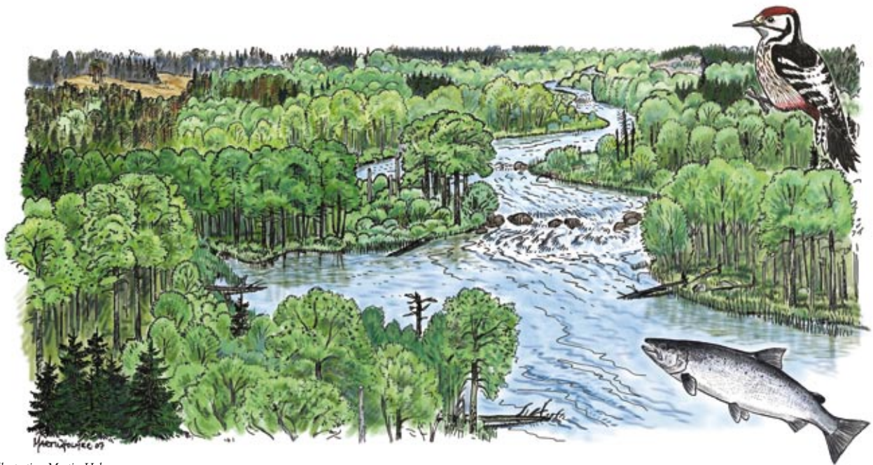
Illustration Martin Holmer