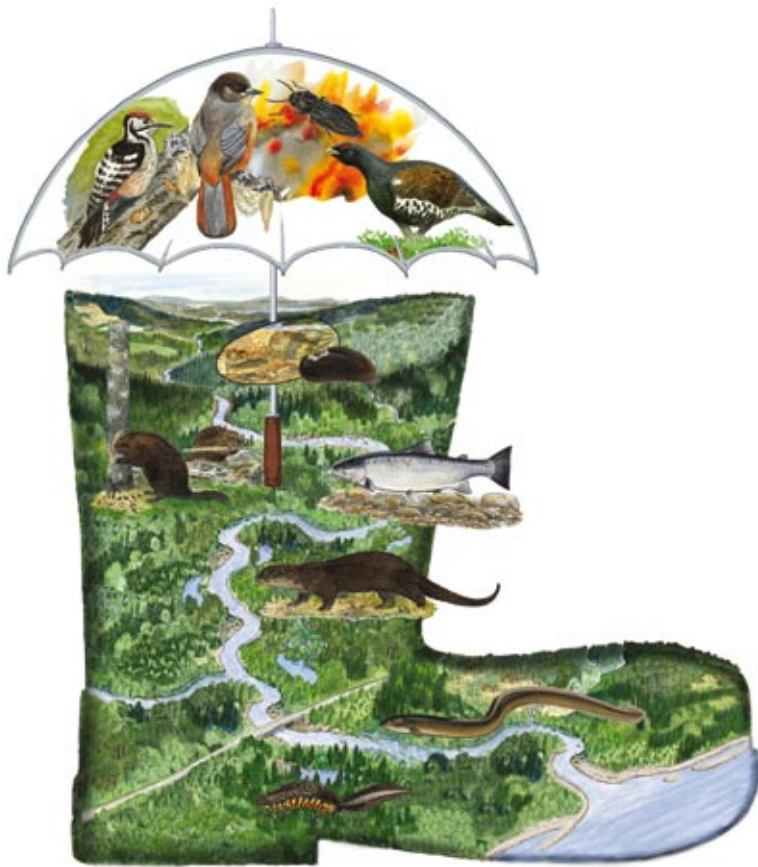
Figur 3. Den rumsliga och tidsmässiga variationen av olika livsmiljöer, processer och funktionella strukturer i olika skalor inom hela avrinningsområden och landskap är avgörande för att vidmakthålla den biologiska mångfalden.