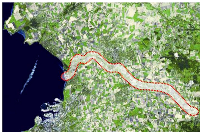
Höje å - ett av de alternativa övningsområdena.

terna ges vissa grundförutsättningar för sitt arbete i tre olika områden i Skåne. Studenterna tränar sig att kommunicera förutsättningar och förslag i tänkta planeringssituationer. De lär sig att använda sin breda