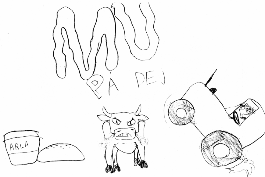
Bild 3. Teckning från ett studiebesök. Källa: Aron i Locknevi skola.