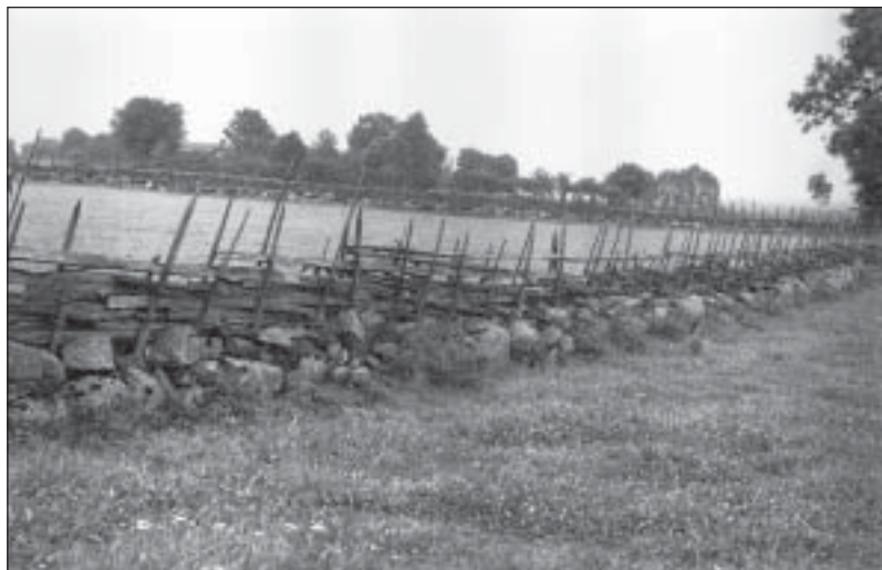
Figur 57. Gärdesgård stängd ovanpå en stenmur. Borgunda socken och Gudhems härad i Västergötland. E.U. 3959. Foto A. Boström 1931.

Det verkar däremot föga troligt att utmarken hägnades i någon nämnvärd omfattning i Norrland som direkt resultat av 1857 års lagstiftning eller laga skifte. Detta då utmarkens areal i förhållande till inägorna på de flesta håll var så överväldigande. Möjligen skulle detta kunna ske i kustområden och mer tätt bebyggda älvdalar men absolut inte i Norrlands inland. Likaså torde fäbodväsendet i södra Norrland minskat behovet av hägnader men däremot torde de forna byalagen behövt stänga i rågångar till andra byar i en högre utsträckning än tidigare. Märk väl att detta är en spekulering som det återstår att bevisa, exempelvis genom att undersöka laga skifteshandlingar samt följa serier av domböcker och i dessa konstatera hur länge överenskommelserna om att behålla skogsbetena på utmarken utan hägnader upprepades för ett och samma skifteslag. (Paragraf 19 i 1857 års förordning stipulerar ju att sådana föreningar skall upprättas skrift-