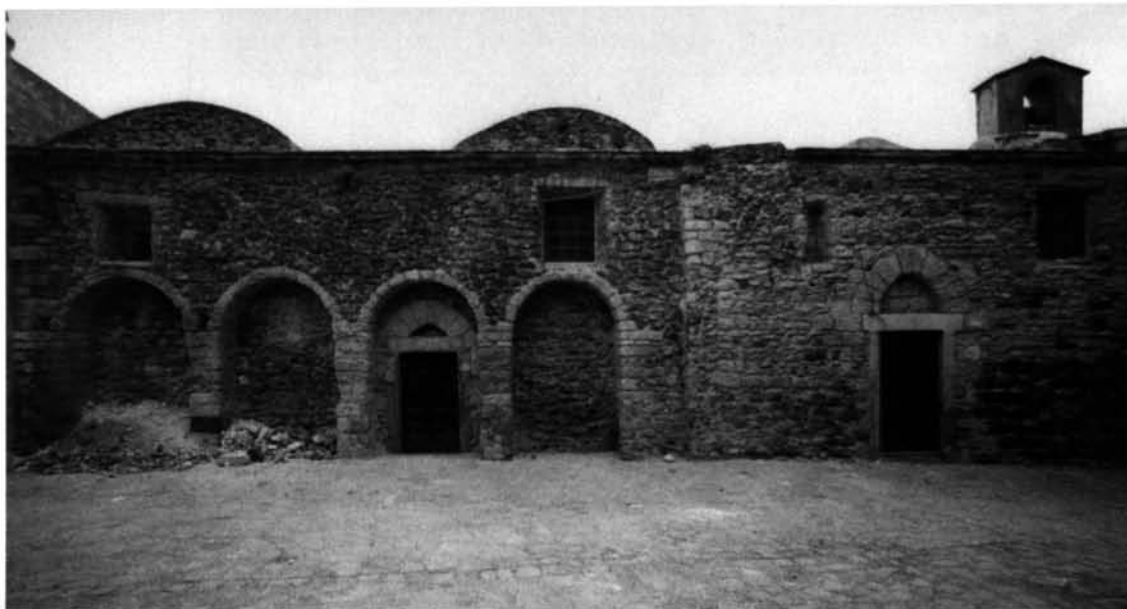
77. La chiesa di S. Maria, a Castelsardo. Castelsardo conserva, nelle chiese del suo centro medioevale, i ricordi d'una devozione e d'un folclore religioso di forte influsso aragonese-spagnolo.

entrò in città, il 26 settembre dello stesso 1329.