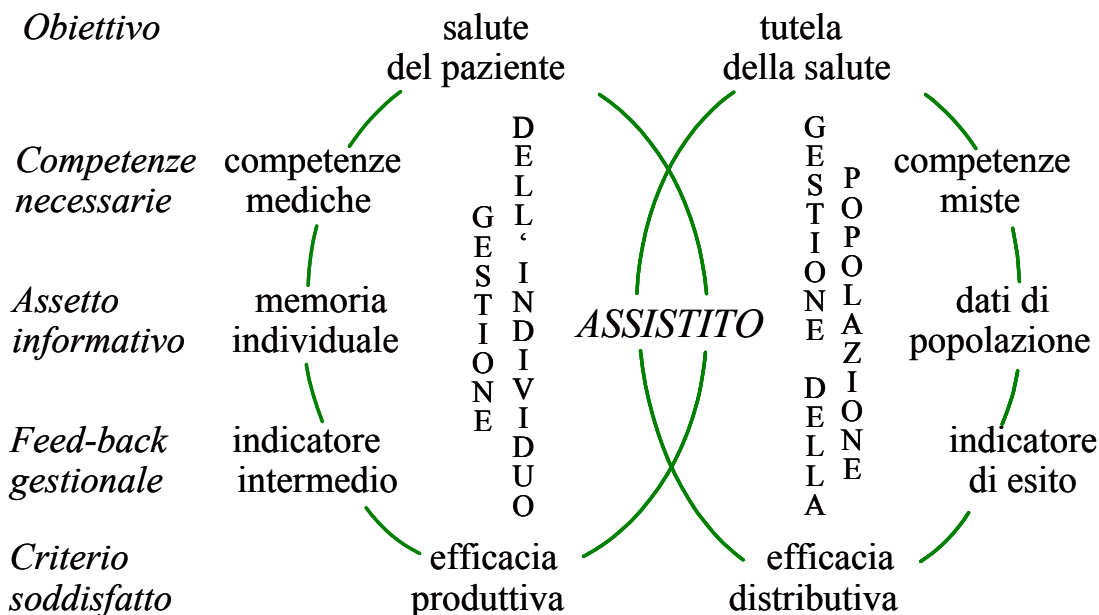
Figura 2. L'integrazione dell'assistenza per la prevenzione cardiovascolare.

Ponendo il cittadino (assistito-paziente) al centro dell'assistenza sanitaria, è possibile trovare una sinergia fra l'attività individuale basata sul rapporto medico-paziente e l'attività di popolazione basata su dati epidemiologici. In altri termini, se nel rapporto medico-paziente l'obiettivo è il controllo degli indicatori intermedi (pressione arteriosa, glicemia, colesterolo, ecc.) nella gestione di popolazione gli indicatori sono i dati di incidenza e prevalenza degli eventi cardiovascolari maggiori (infarto miocardico acuto, ictus, ecc.).