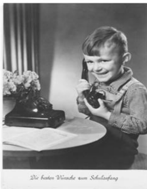
← Ansichtskarte Nr. 6