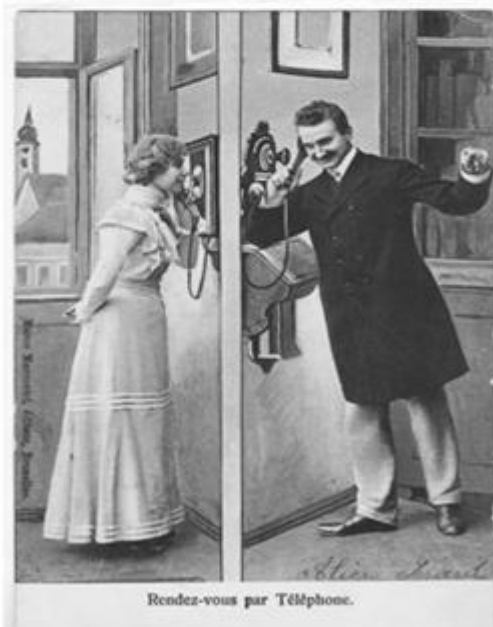
← Ansichtskarte Nr. 3