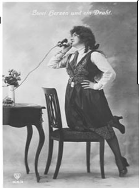
← Ansichtskarte Nr. 4

Privaträume. Beide Telephone sind aber Wandapparate, welche wiederum belegen, dass der Gebrauch des Telephons hier noch nicht in ein routinemäßiges Handeln übergegangen ist. Und dieses Bild lässt es schlussendlich offen, ob sich die Gesprächspartner während des Telefonats sehen oder nicht.