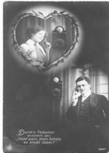
Ansichtskarte Nr. 2