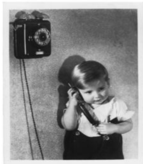
Ansichtskarte Nr. 5