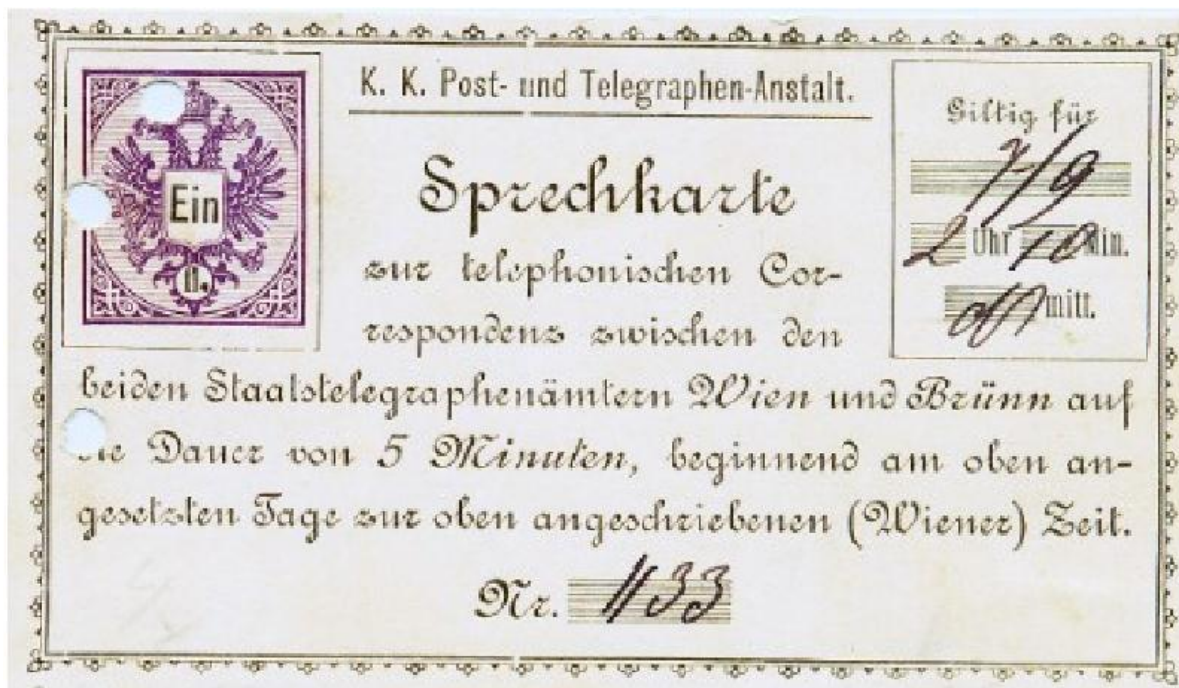
Abb. 1: Sprechkarte um 1900. Diese Karten konnten beim Öffentlichen Fernsprechen eingesetzt werden.