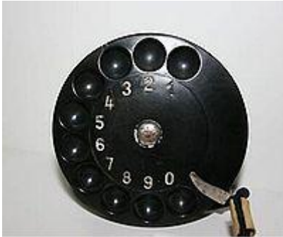
Abb. 5: Fingerlockscheibe (SABA-Nummernschalter), Jahr 1946 94

Einstellen der runden Wählscheibe sein. Das Rund der Wählscheibe verweist einerseits auf die vertraute Handhabung der Uhr, auf der anderen Seite aber nicht nur bloß auf die Tatsache, dass jemand gehört werden kann, sondern darüber hinaus auch auf das „Was“, also inhaltlich; was wiederum auf den ausgewählten Teilnehmer Bezug nimmt, bzw. das „Wie“ also qualitativ: z.B. besonders rauschfrei. Dies stellte sogar damals bereits ein werbewirksames Mittel dar. So wird beim Telefon mit der Wählscheibe das Aus-Wählen-Können zum zentralen Formthema erhoben. 93