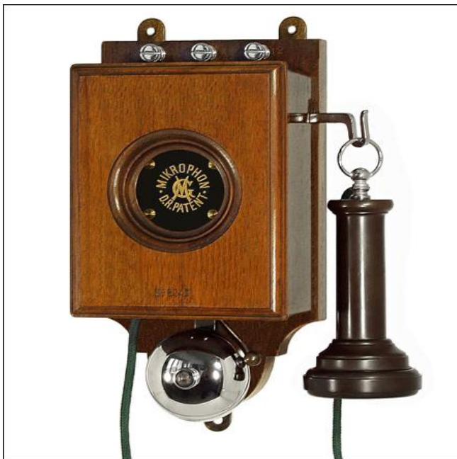
Abb.3: Wandapparat, vermutl. aus dem Jahre 1895. 90

Auch wenn das Telephon bereits in den 1870er Jahren erfunden worden war, als serienreifes Gerät bzw. als Gebrauchsgegenstand begann es erst ab ca. 1890/1900 die ersten privaten Haushalte von Kaufleuten, hohen Amtsträgern usw. und die (öffentlichen) Amtsstuben zu erobern. In der Frühzeit der Telephonie aber stellten vorerst die öffentlichen Sprechstellen, die „Telefon-Zellen“, vor allem für Private fast den einzigen Zugang zu einem Telefon überhaupt dar. Das unterstreicht zudem die Tatsache, dass das Telefon nur in Ausnahmesituationen, als Notfall- und Notrufmedium genutzt wurde. 89