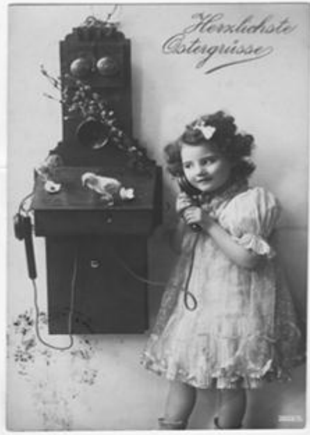
← Ansichtskarte Nr. 1

kehrendes Motiv in der Literatur. So gesehen fungiert diese Karte als Dokumentation und Erinnerung zugleich, weil die Karte selbst als physisch greifbares (visuelles) Kommunikationsmittel, selbst wiederum – auf der Metaebene sozusagen – ein (auditives) Kommunikationsmittel (das Telefon) abbildet. Die Karte ist auch dann da, wenn das Kind sich längst verflüchtigt hat. Die geschriebenen Worte „Herzliche Ostergrüße“ bekunden zugleich den Zwang, gesprochene flüchtige Worte „sicherheitshalber“ auf Papier