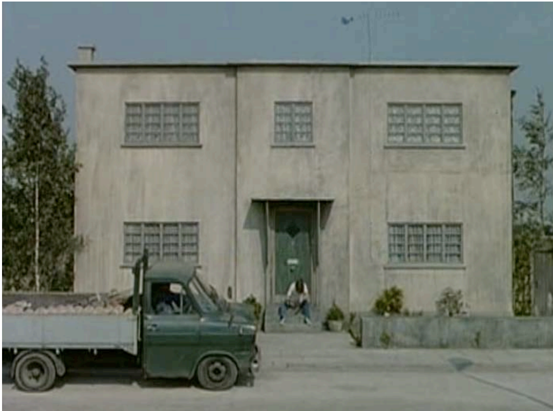
Abb. 6 ( The Cement Garden , 1'36", VLC): Establishing Shot 2 – Totale vom Haus, von links fährt der Lieferwagen ins Bild ein.

Damit wird ein Handlungsraum bestimmt, dem der Mensch untergeordnet ist. Alle Elemente, welche für die Lokalisation folgender Aktion notwendig sind, werden positioniert. 310 Gleichzeitig sieht der Zuschauer bei der Anlieferung der Zementsäcke, Katalysatoren der Geschichte, zu, denn diese werden auf dem Lieferwagen, der von links in die Totaleinstellung des Hauses einfährt, in den Einstellungsraum aufgenommen. Damit wird eine überwiegend geschlossene Raumstruktur – Vorgabe des Romans – dem Zuschauer unvermittelt und noch während der Vorspann überblendet wird, kommuniziert. Das Geschehen findet in Haus und Garten statt, auf die Welt außerhalb wird erst am Ende der Geschichte wieder Bezug genommen, indem Julie sagt: „There!“ she said, „wasn't that a lovely sleep.“ 311