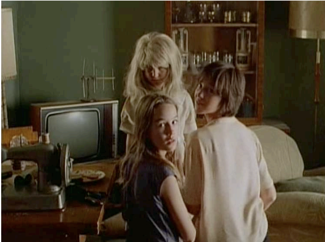
Abb. 7 ( The Cement Garden , 56'57'', VLC): Jack beobachtet seine Geschwister; die subjektive Kameraeinstellung aus Jacks Perspektive

Handlungsebene hinaus charakterisiert, ist die Genauigkeit, mit welcher Sinneswahrnehmungen und Empfindungen beschrieben werden. 312 Hierfür mitverantwortlich ist einerseits die Ich-Erzählsituation im Roman, die von Birkin als cardinal function aufgegriffen wird und mit filmisch-szenischen Mitteln umgesetzt wird. Durch subjektive Kamerasequenzen werden Einstellungen aus Jacks Blickwinkel gezeigt. Sie dient damit als Pendant zur Ich-Erzählsituation im Roman. Hierzu ein beispielhafter Screenshot: