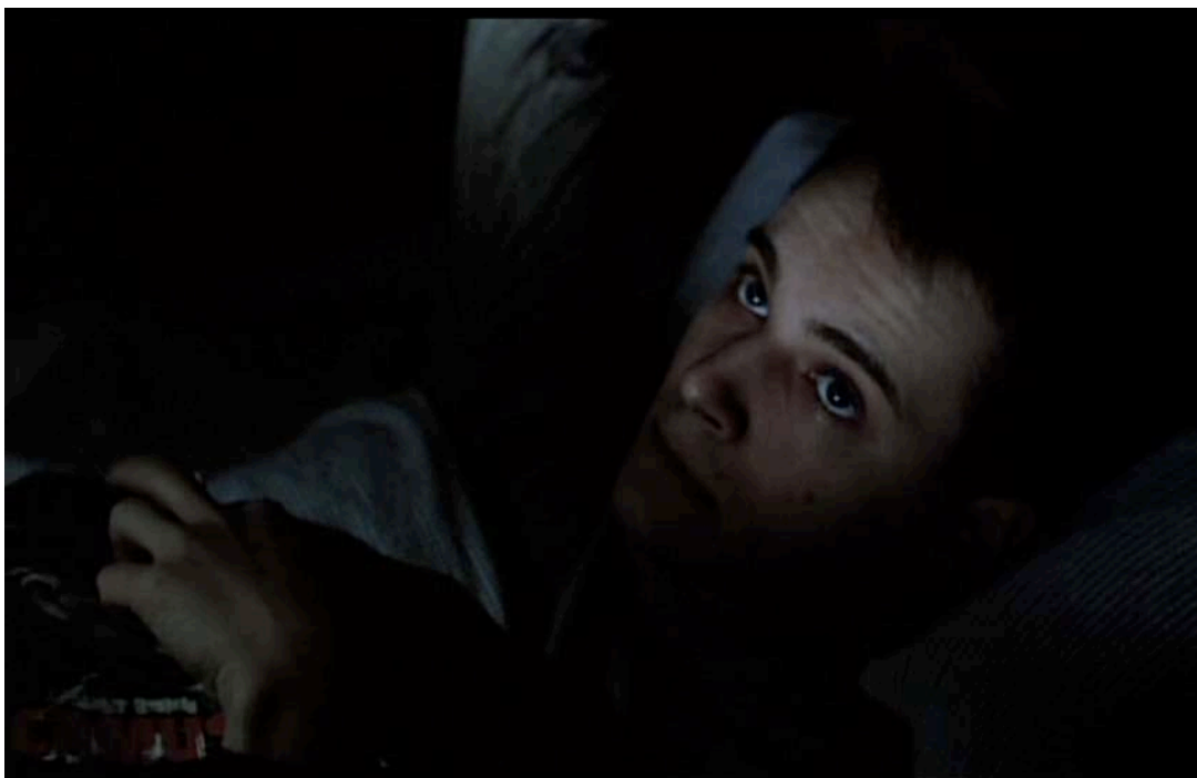
Abb. 9 ( Die Ausgesperrten , 1:23'53'', VLC): Aufsicht, Nahaufnahme.

Protagonisten – im räumlichen wie übertragenen Bereich – als zentrales Motiv gemein. Auf die Ab- und Ausgrenzung der Protagonisten konzentriert sich Franz Novotny in seinem Spielfilm Die Ausgesperrten . Die Einstellungsperspektive ist weitestgehend Normalsicht, Abweichungen hiervon ziehen die Aufmerksamkeit auf sich. Etwa das Ende der letzten Szene vor dem Mord, als Peter vom Stöhnen seiner Schwester und Hans gestört, wach im Bett liegt. Die Kamera ist hier in Nahaufnahme oberhalb des Kopfes positioniert, der aufschauende Blick Peters ist damit besonders gut zu sehen und verweist auf Bevorstehendes. Das Weiß seiner Augen leuchtet hell und wirkt beängstigend, kalt.