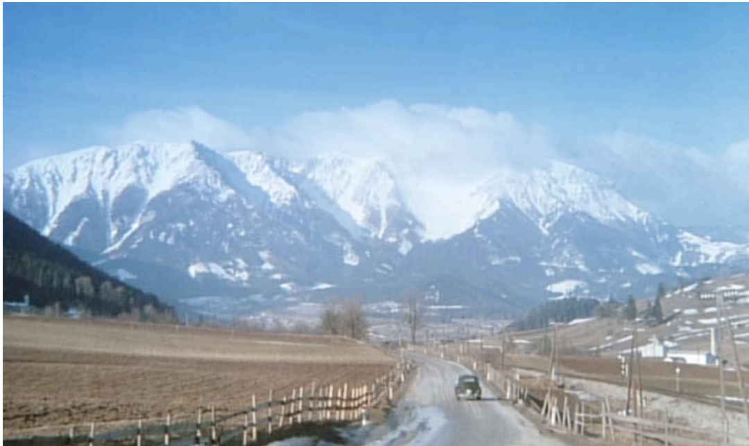
Abb. 4 ( Die Ausgesperrten , 1:32'05", VLC): Die letzte Totale.

Demnach geht es bei der Darstellung des Familienmordes um einen Tabubruch, der im Film noch um die Tötung einer weiteren Person, Hans, erweitert wird. Im Anschluss an die Tat wäscht sich Peter rein und verlässt im elterlichen PKW die Stadt. Damit wird zum ersten Mal innerhalb des Films auch der geschlossene Raum Großstadt verlassen. 309