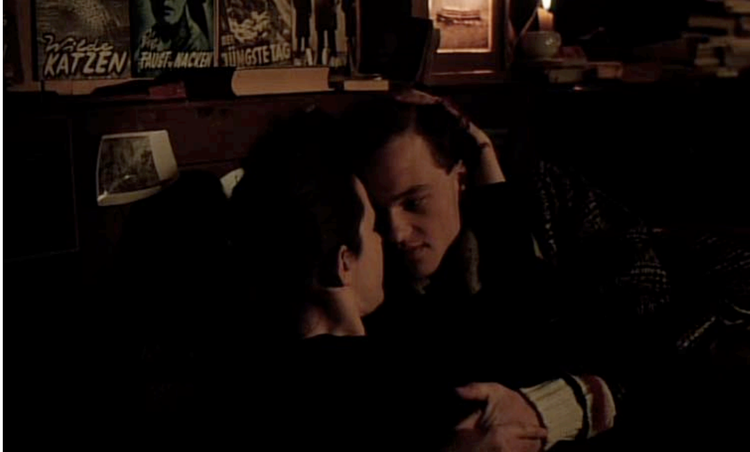
Abb.3 ( Die Ausgesperrten , 26'01", VLC): Beengte Zweisamkeit – Anna und Hans.

Abb.3). Die nahe Kameraeinstellung bewirkt, dass die Köpfe der gezeigten Figuren charakteristisch im Mittelpunkt stehen. Im Hintergrund deutlich im Kerzenschein zu sehen sind die Filmplakate „Wilde Katzen“ 304 , „Die Faust im Nacken“ 305 und „Der Jüngste Tag“ 306 .