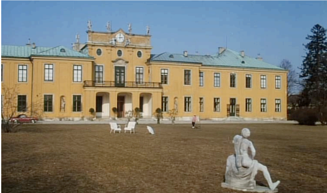
Abb.2 ( Die Ausgesperrten , 13'36'', VLC): Die Prunkvilla der Pachhovens, großzügig mit einer Totale in Szene gesetzt.

Sophie trägt gemäß Romanvorlage „fast immer irgendwelche Sportbekleidung“ 299 , ist unnahbar, steht außen vor bzw. immer auf der den Zwillingen gegenüberliegenden Seite des Raumes/Bildes, trägt als einzige helle bzw. weiße Kleidung. Sie ist wie ein haltloses Irrlicht 300 und dient paradoxer Weise gerade als solches auch in der Adaptation als Haltepunkt. Die ökonomische wie soziale Kluft zwischen Ober- und Unterschicht wird durch Sophies Auftreten bildlich dargestellt, indem sich die Figur stets von der grauen Masse abhebt.