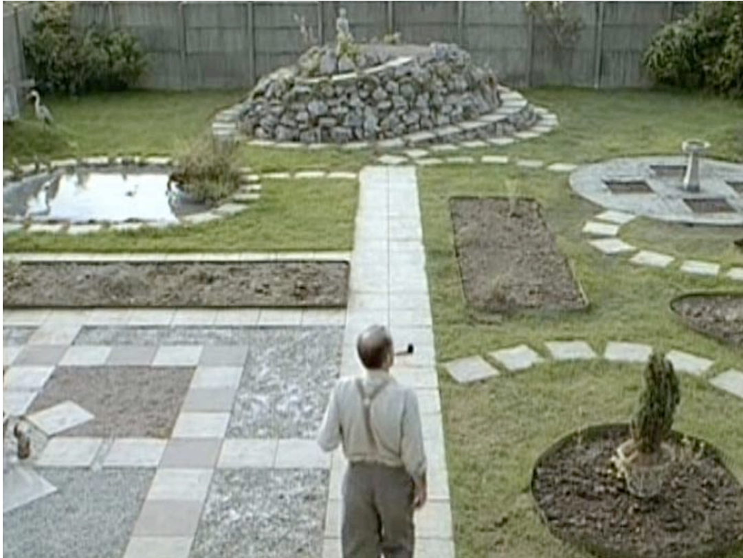
Abb. 5 ( The Cement Garden , 1'27", VLC): Establishing Shot 1 – Totale vom Garten – im Vordergrund der Vater

des Films die entscheidende Passage von Jack und seinem Vater, der während dem Zementieren tot zusammenbricht. Der handlungstragende Faktor Isolation wird umgehend aufgegriffen, indem der Einstellungsraum mit zwei Totalen aufgenommen wird. Die erste zeigt den Garten, die zweite das Haus.