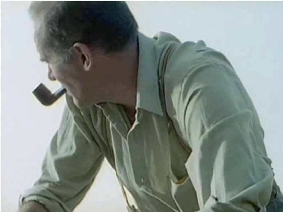
Abb. 8 ( The Cement Garden , 8'19", VLC): Die Silhouette von Jacks Vater vor ausdruckslos weißem Himmel.

against the white, featureless sky behind him.“ 313 Anbei der dazu passende Screenshot.