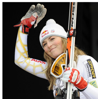
Abbildung 6: „Schisport Damen“ (Neutral weiblich)