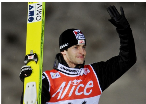
Abbildung 5: „Schisport Herren“ (Neutral männlich)