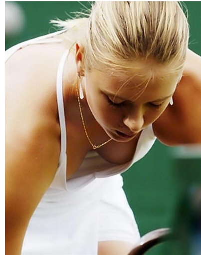
Abbildung 2: „Damentennis“ (Typisch weiblich)