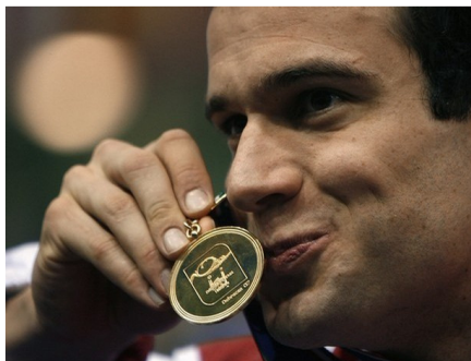
Abbildung 3: „Schwimmmedaille“ (Untypisch männlich)