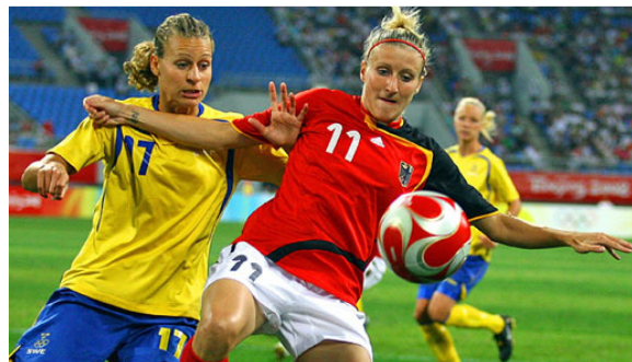
Abbildung 4: „Frauenfußball“ (Untypisch weiblich)