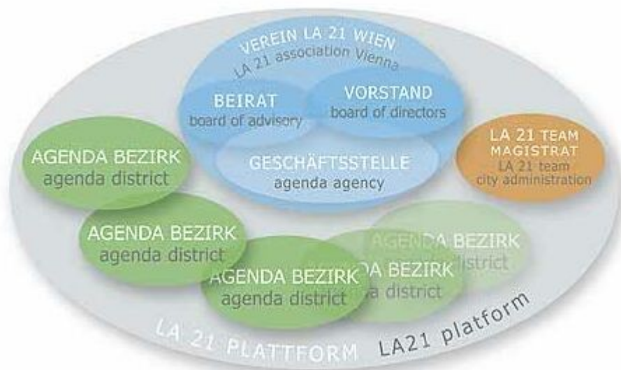
Abbildung 1: Die Struktur der LA21-Wien auf städtischer Ebene

Die Stadt Wien hat nach dem erfolgreichen Pilotprojekt „LA21 Alsergrund“ im Jahr 2002 einen Verein „Lokale Agenda 21 Wien zur Förderung von BürgerInnenbeteiligungsprozessen“ gegründet, der die Basis für die wienweite LA21 darstellt. (s.u. Abbildung 1) Dieser vom Wiener Gemeinderat beschlossene Verein ist die zentrale Koordinationsstelle für die Finanzierung und für das Management der dezentralen auf Bezirksebene angesiedelten Lokalen Agenda Prozesse. (Lokale Agenda 21 Wien)