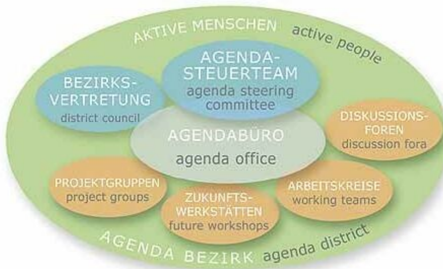
Abbildung 2: Struktur der LA21 Wien auf Bezirksebene

können. Sie werden durch BezirksvertreterInnen unterstützt, die die Umsetzung der Projekte realisieren sollen.