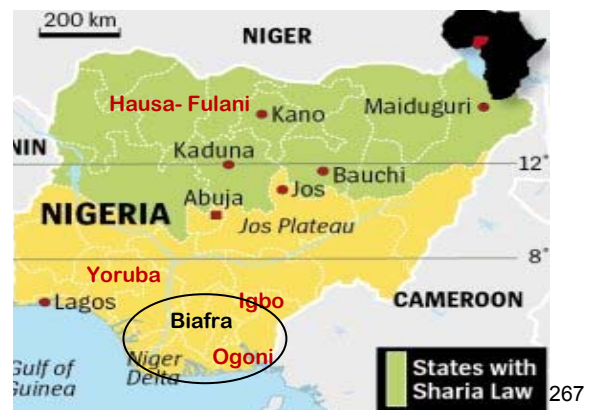
Abb. IV: Kartographische Darstellung: Nigeria

Der fast dreijährige Krieg forderte nach Schätzungen zwischen 1,5 und 2 Mio. Todesopfer, wobei vor allem die von Nigeria verhängte Hungersblockade über Biafra nicht nur von der internationalen Gemeinschaft im Nachhinein als Völkermord bezeichnet wurde, sondern auch