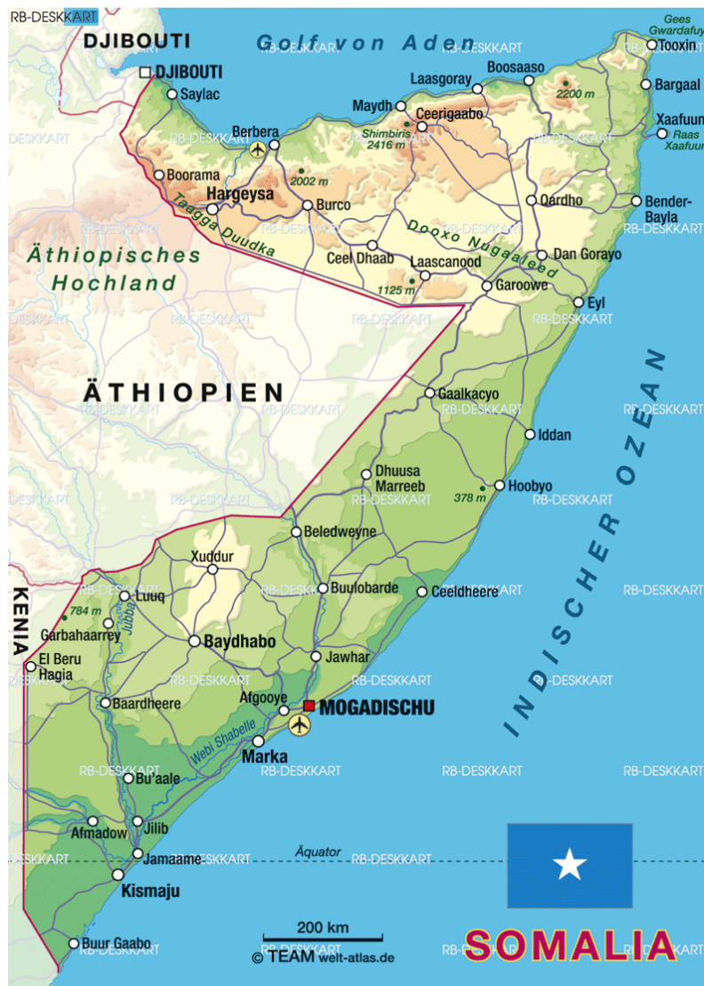
Abbildung 1 4

Dieser Abschnitt soll einen Überblick über das Land und seine Geschichte geben. Ebenso soll ein Überblick über den Verlauf und die Hintergründe des somalischen Bürgerkrieges gegeben werden. In den Kapiteln 4 und 5 werden die verschiedenen Aspekte aus Gesellschaft, Politik und Bürgerkrieg wieder aufgegriffen und detaillierter dargestellt und in Verbindung mit den Konflikttheorien diskutiert.