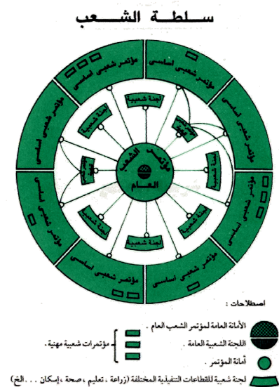
Organigramm der «Volksmacht»

Das Grüne Buch – genauer: der erste Teil – liefert keine Theorie der Gewaltenkontrolle in einer Volksdemokratie. Die Konzeption der „Volksmacht“ ist nicht gerade von Vorteil für die Erdölindustrie oder das allgemeine Gesundheitswesen, die eine Hierarchie (von Entscheidungsträgern) benötigen. 357 Daher scheinen die Libyer zwar theoretisch mehr Kontrolle über öffentliche Angelegenheiten ausüben zu können als Menschen in den „westlichen“ Demokratien (z.B. in den Vereinigten Staaten, oder im Vereinigten Königreich), tatsächlich können sie nicht über die politischen und militärischen Führer oder das (öffentliche) Budget bestimmen. Auch die Erdölindustrie, als Hauptfaktor des Wohlstands, liegt – wie oben bereits erwähnt – außerhalb ihrer Kontrollbefugnisse. Dies ermöglicht al-Qaddāfi einen breiteren Handlungsspielraum für Manœuvre als etwa andere Führer hoch entwickelter Industriegesellschaften verfügen – in einer hydrocarbon society ohne Repräsentation, die das Regieren komplizieren würde und seiner Auffassung des „Volkswillens“ entgegenstände.