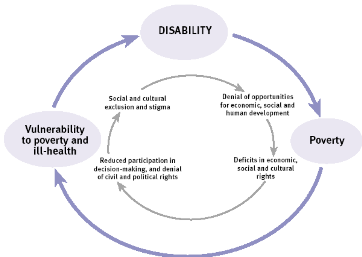
Abb.2: „Armut und Behinderung – ein Teufelskreis“

In diesem Sinne gilt es hier festzuhalten, dass (chronische) Armut sowohl eine Ursache als auch die Konsequenz von Behinderung sein kann. In der Literatur wird dieser Sachverhalt meist als „Teufelskreis“ bezeichnet und dargestellt. Nachstehend ist eine Grafik aus dem Positionspapier des britischen Department für International Development (DFID) zur Veranschaulichung eingefügt.