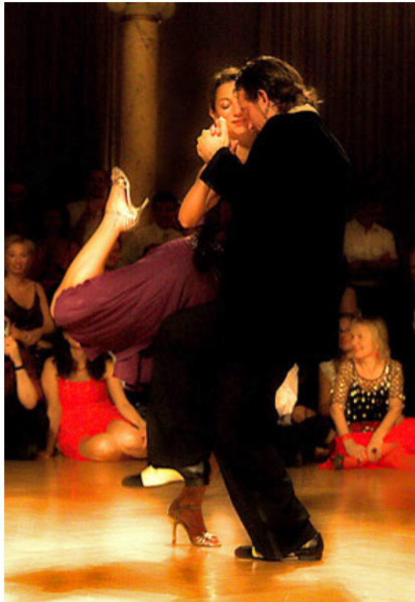
Abb. 9: Die schöne Tänzerin

Die Folgerolle ist also charakterisiert einerseits durch Hingabe, aber auch durch die Fähigkeit „bei sich“ zu bleiben und in der eigenen Achse zu stehen. Mit zunehmendem Können kommt der Dame auch die Aufgabe zu, Verzierungen mit den Beinen zu machen, den Tanz aktiv mitzugestalten sowie dem Mann ein Gefühl von Geborgenheit zu vermitteln.