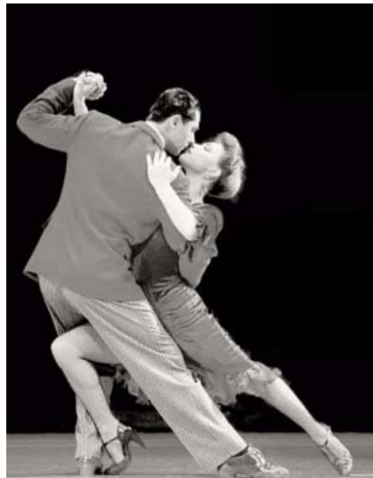
Abb. 1: Nostalgisches Tangopaar

An die Stelle des Gedankens „wie komisch das jetzt eigentlich sei“, trat ein Zustand, in welchem ich eigentlich vergaß, „wer“ der andere war, mit dem ich da tanzte, ich die Augen schloss und mich in einem wohligen sicheren Zustand des „Geführt - Werdens“ befand, ohne ein optisches Bild der anderen Person vor mir zu haben. Unbestreitbar ein sehr angenehmer, entspannender Zustand, aus welchem man nach dem Tanz, zurückgeholt in die Realität, eher „unsanft“ erwacht.