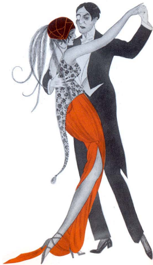
Abb. 4: Tango in Europa

degradierte den Tango also als „unargentinisch“, weil hybrid, und meinte, nichts davon komme aus Argentinien, denn die Vorstadt wäre nicht Argentinien. Im Ausland konnte man die Entrüstung, die der Tango bei der argentinischen Oberschicht hervorrief, nicht nachvollziehen, denn ihnen repräsentierte sich ein gediegener Tanz, der keine Bewegung enthielt, die nicht auch das züchtigste Fräulein auszuführen vermochte. Dies hatte damit zu tun, dass die argentinischen Tanzlehrer den Tanz veränderten, vor allem hinsichtlich der cortes und quebradas , er wurde filigraner, der dortigen Gesellschaft angepasst und seine sinnliche Temperatur gewissermaßen abgekühlt. In Argentinien meinte man, ihm wurde der Geschmack genommen und er verlor seine Verruchtheit (Salas 2002: 78ff). Mit der darauf folgenden Ausbreitung des Tango in andere europäische Länder entwickelte sich in jedem Land ein eigener Stil, nicht nur die Tanzschritte, sondern auch die Kleidung betreffend (Cooper 1995: 67ff). Die europäische Übernahme und die Umgestaltung des Tanzes hatte zur Folge, dass der heute in den Tanzschulen Wiens unterrichtete Tango kaum mehr etwas mit jenem Tango gemein hat, der in Argentinien seinen Anfang nahm (Günther 1959: 230ff).