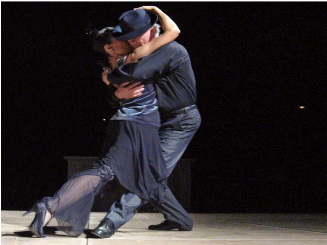
Abb. 11: Die Tangoumarmung

Die Faszination des Tango fällt für jeden Menschen auf ganz spezifische Weise aus und richtet sich nach den Bedürfnissen des Einzelnen. Generell stellen die virtuose Technik, die Musik, das Ausleben von Geschlechterrollen aber auch die besondere Begegnung zwischen zwei Menschen, die trotz aller Nähe und Zuneigung keine Folgen impliziert sowie das Einsteigen in eine vom Alltag abgehobene „Parallele Welt“ wichtige Faktoren für die Faszination des Tango dar.