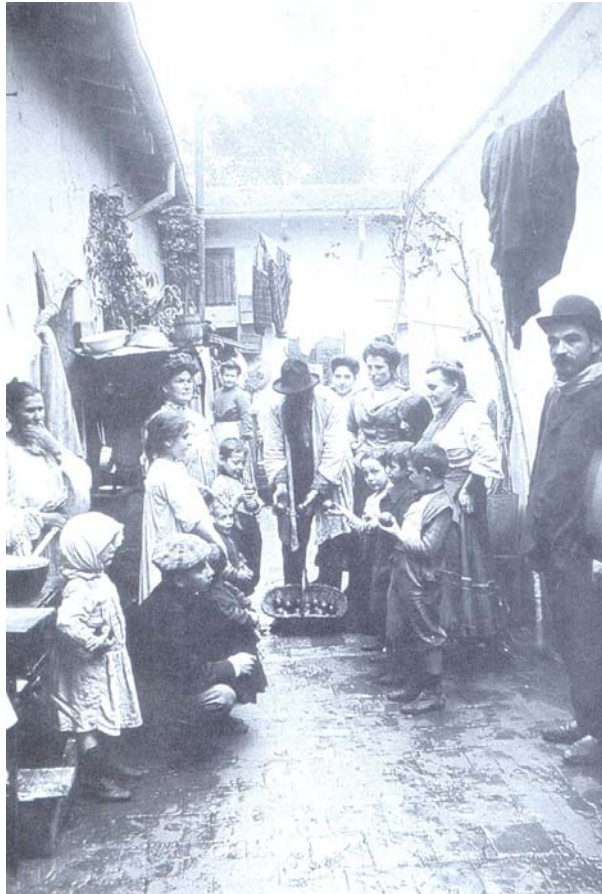
Abb. 3: Das Leben der Menschen im Conventillo

geographisch neue Räume erschlossen und nun auch vermehrt die den historischen Kern umliegenden Gebiete besiedelt wurden (Collier 1995: 34, Janke 1984: 43). Der enorme Bevölkerungszustrom in die Städte am Rio de la Plata äußerte sich zunächst auch in einer äußerst schlechten Wohnsituation, wobei sich die Einwanderer in so genannten „ conventillos “ (Wohnquartieren) zusammenpferchten, und dort meist zu unmenschlichen Bedingungen „hausten“ (Salas 2002: 45ff).