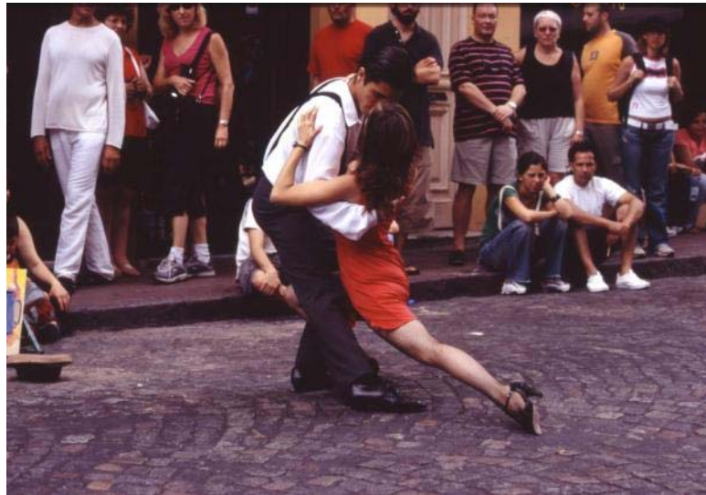
Abb. 7: Tanzpaar auf der Strasse

Mann und Frau sind ihrer Meinung nach beide gleichermaßen verantwortlich für das Paar, doch jeder hat seine eigene Rolle. Die Bedeutung des Tanzes käme nicht über einen Triumph des Mannes über die Frau zur Geltung (ebd.:176).