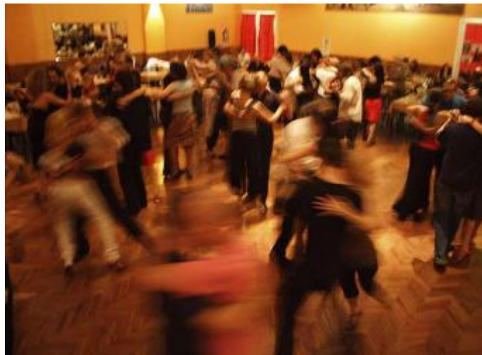
Abb. 6: Eine Milonga in Buenos Aires

In Europa können diese Codes nur schwer Fuß fassen, wobei „eingefleischte Vertreter der Wiener Tangoszene“ diese als äußerst wichtigen Bestandteil des Tangos ansehen.