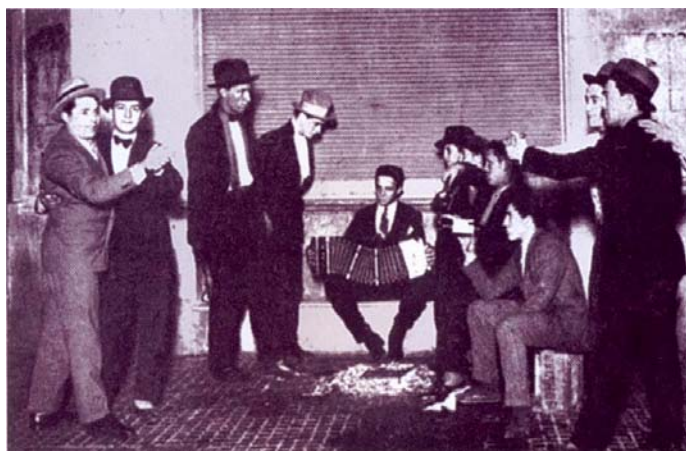
Abb. 2: Männertango in Buenos Aires

Trotz dieser Erklärung stellt die oben genannte Perspektive eine Möglichkeit dar, die Geschlechterrollen im Tango zu „denaturalisieren“ und auf mögliche verborgene Elemente hin zu untersuchen (vgl. Saikin 2004).