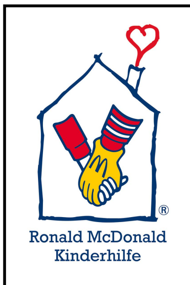
Abbildung 3: Logo der Ronald McDonald Kinderhilfe

Das Logo der Ronald McDonald Kinderhilfe: