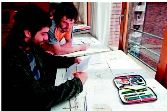
Clase de diseño. 2007. Archivo del Centro.

La Historia del Arte entendida no como acumulación de datos y nombres, de fechas y conceptos fuera del mundo real del alumno. La Historia del Arte como una sucesión más o menos lógica y contextualizada, donde se entiende y comprende las motivaciones principales y generales de la evolución artística de la humanidad. Muy visual, donde la parte fundamental es la audiovisual y los ejercicios como una auto-comprobación de los temas estudiados.