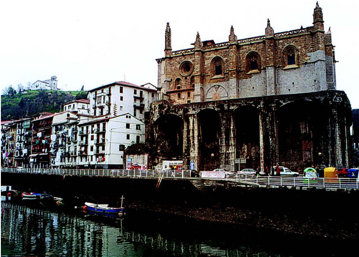
ONDARROA. AURRE-AURREAN, SANTA MARIA ELIZA

Azken etapan hiribildu bakarra sortu zuten, lehen bi etapetako helburua, ekonomikoa, kontuan hartuta: Gernika. Mundaka