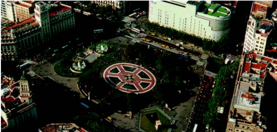
Fig. 1. Aspecto actual de la Plaza de Cataluña 8 .

Dos puntos más sirven de marco para la acción en el territorio de la Plaza. El Monumento a Francesc Macià, ubicado en su esquina suroeste, se encuentra en la parte más baja de la Plaza de Cataluña y tiene forma pentagonal. Al centro del mismo se ubica una columna irregular que sirve de marco para el busto del ex presidente y se encuentra rodeado de un área de césped cuyo perímetro está constituido por una barda baja.