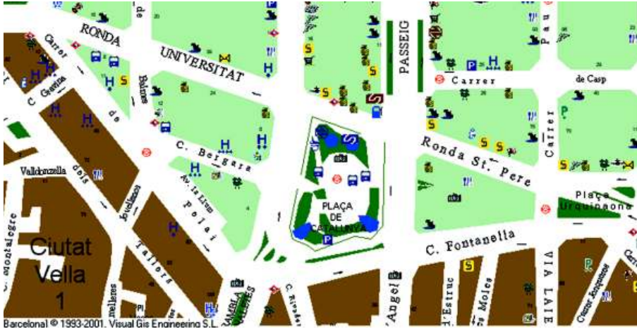
Fig. 2. Calles aledañas a la Plaza de Cataluña: La Rambla, Passeig de Gràcia, Les Rondes Universitat y Sant Pere, Pelai, Fontanella y Portal de l'Àngel

La variedad de puntos de conexión e intercambio no es extraño, dada su ubicación como punto de conexión y frontera de varias de las calles principales de la ciudad (Fig. 2) así como punto de enlace entre la parte antigua de Barcelona (lo que formaba la ciudad hasta antes del derribo de sus murallas) y su nueva ampliación (L'Eixample), con base en el "Plan Cerdà" aprobado por el Real Decreto del 7 de junio de 1859 9 .