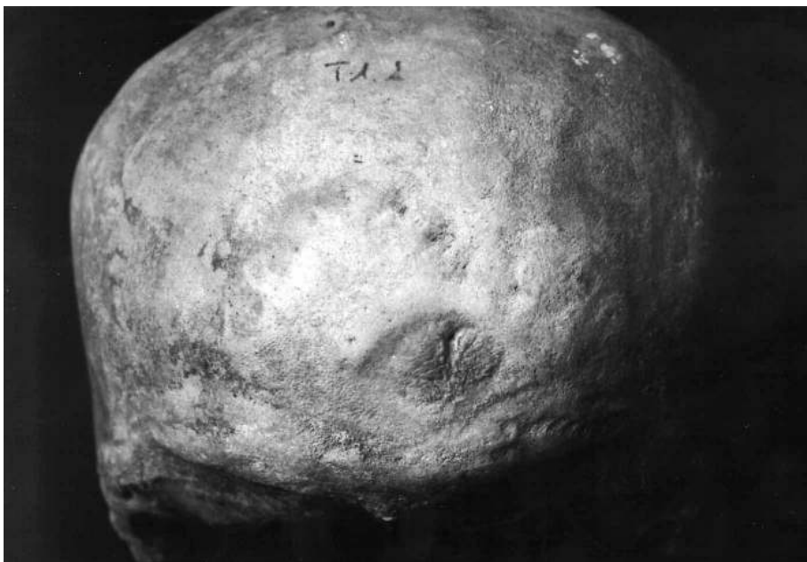
Fig. 4. Cráneo del varón enterrado en el Sepulcro de la Iglesia de San Pedro de Tabira (Durango): lesiones sobre el frontal (arriba) y el occipital (abajo).