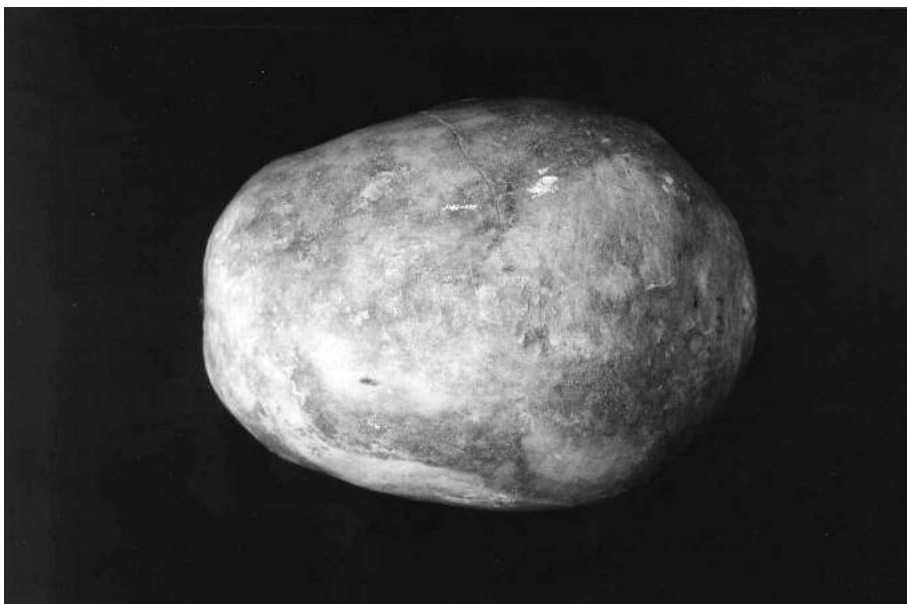
Fig. 2. Cráneo del varón enterrado en el Sepulcro de la Iglesia de San Pedro de Tabira (Durango), normas lateral (arriba) y superior (abajo).