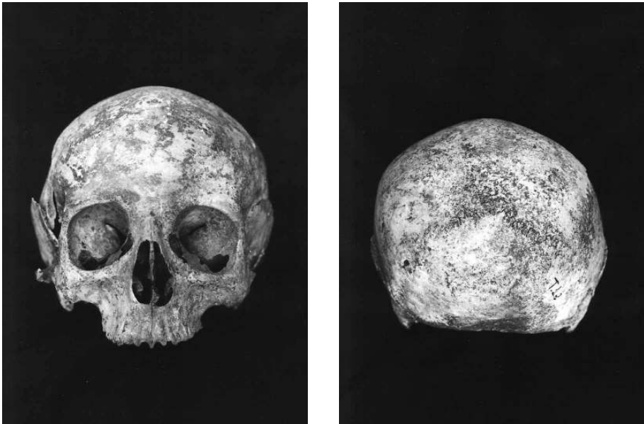
Fig. 6. Cráneo de la mujer enterrada en el Sepulcro de la Iglesia de San Pedro de Tabira (Durango), normas anterior (arriba) y posterior (abajo).

Con este estudio, hemos pretendido contestar a las interrogantes históricas e incluso populares sobre la identidad y características antropológicas de los sujetos enterrados en este templo, que muy probablemente son hijos de la tierra, y por tanto depositarios de una herencia biológica e histórica.