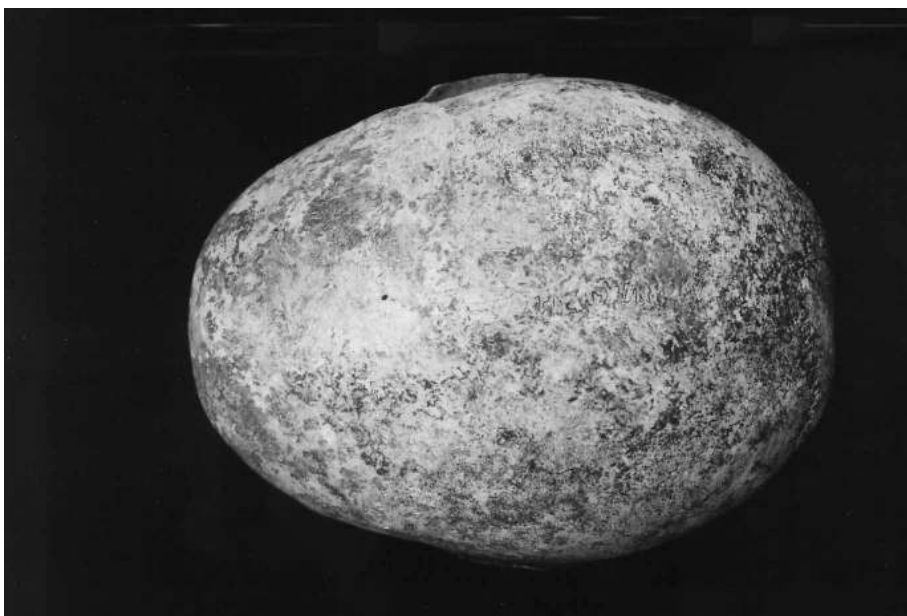
Fig. 5. Cráneo de la mujer enterrada en el Sepulcro de la Iglesia de San Pedro de Tabira (Durango), normas lateral (arriba) y superior (abajo).