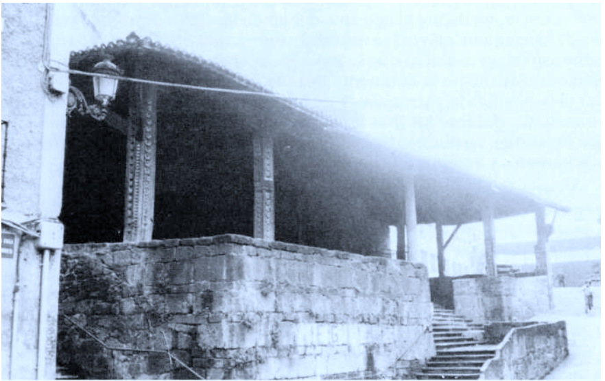
Pértico de Placencia de las Armas.