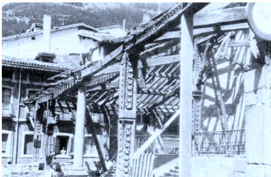
Con el desmontaje de la estructura del atrio sorluzetarra, queda iniciado el proceso de su reconstrucción.