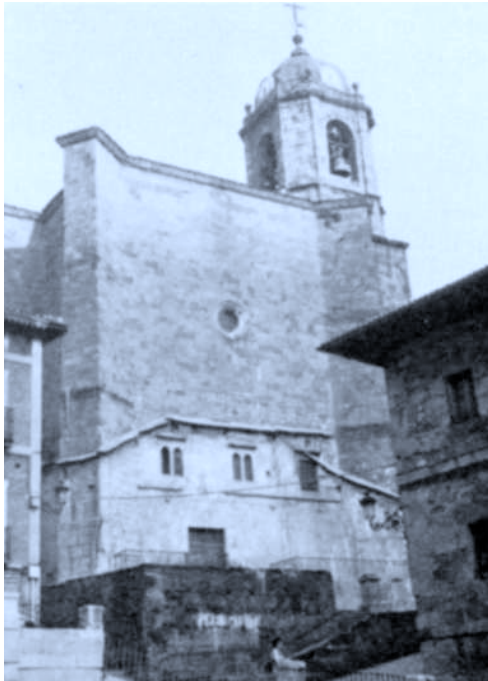
Iglesia parroquial de Santa María la Real de Placencia de las Armas. El pórtico ha sido desmontado para su reconstrucción.