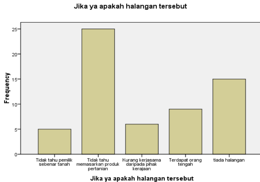
Rajah 1.2. Halangan terhadap dalam usaha mengerakkan aktiviti