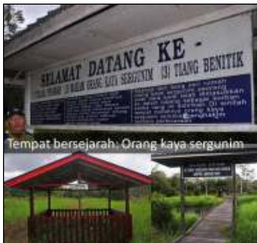
Rajah 4. Sekitar Makam orang kaya Segunim