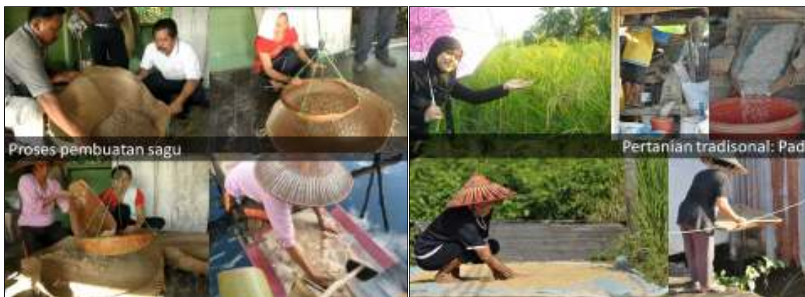
Rajah 5. Proses penghasilan sagu secara tradisional

Penanaman padi secara tradisional juga merupakan potensi agro-pelancongan di kawasan ini (Rajah 6). Sebanyak 8.01 peratus responden berpendapat para pelancong dapat melihat proses penanaman padi yang masih dijalankan secara tradisional di kawasan ini. Kebanyakan kawasan di Malaysia pada masa kini menjalankan penanaman padi secara moden dan komersil. Maka, secara tidak langsung, pelancong tidak kira dalam dan luar negara dapat menghayati nilai estetika yang masih wujud di Matu-Daro.